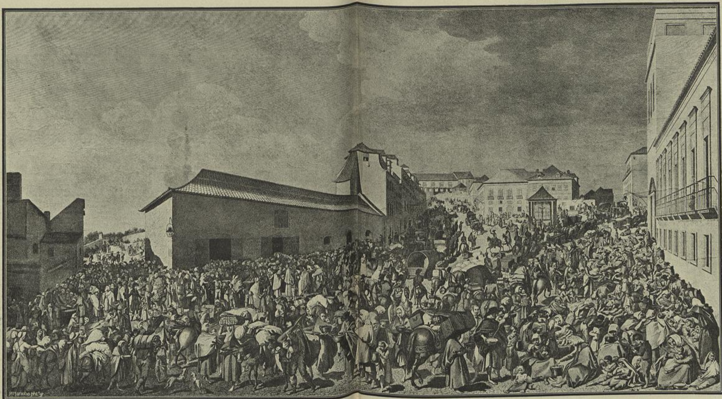
Dom. Ant. de Sequeira Ac. Rom. inv. del. e abrio os cont. das fig.