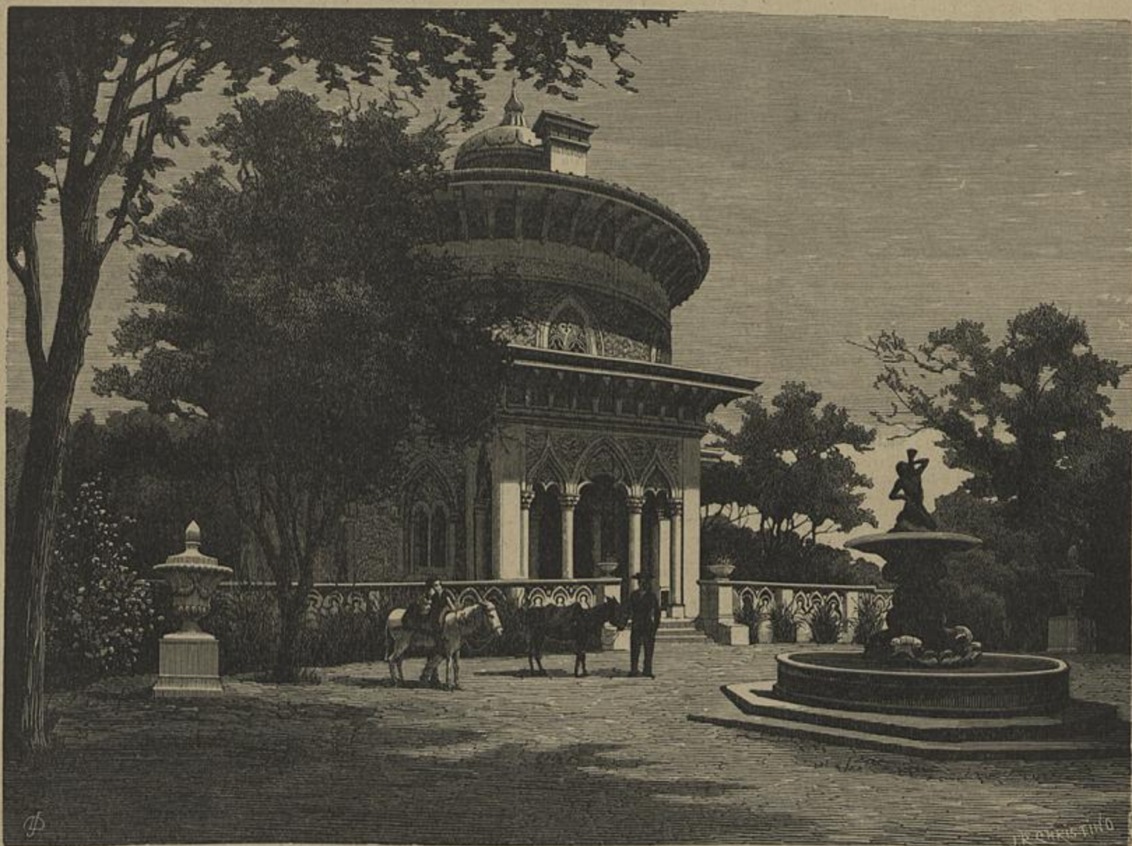
MONSERRATE — ENTRADA DO PALACIO