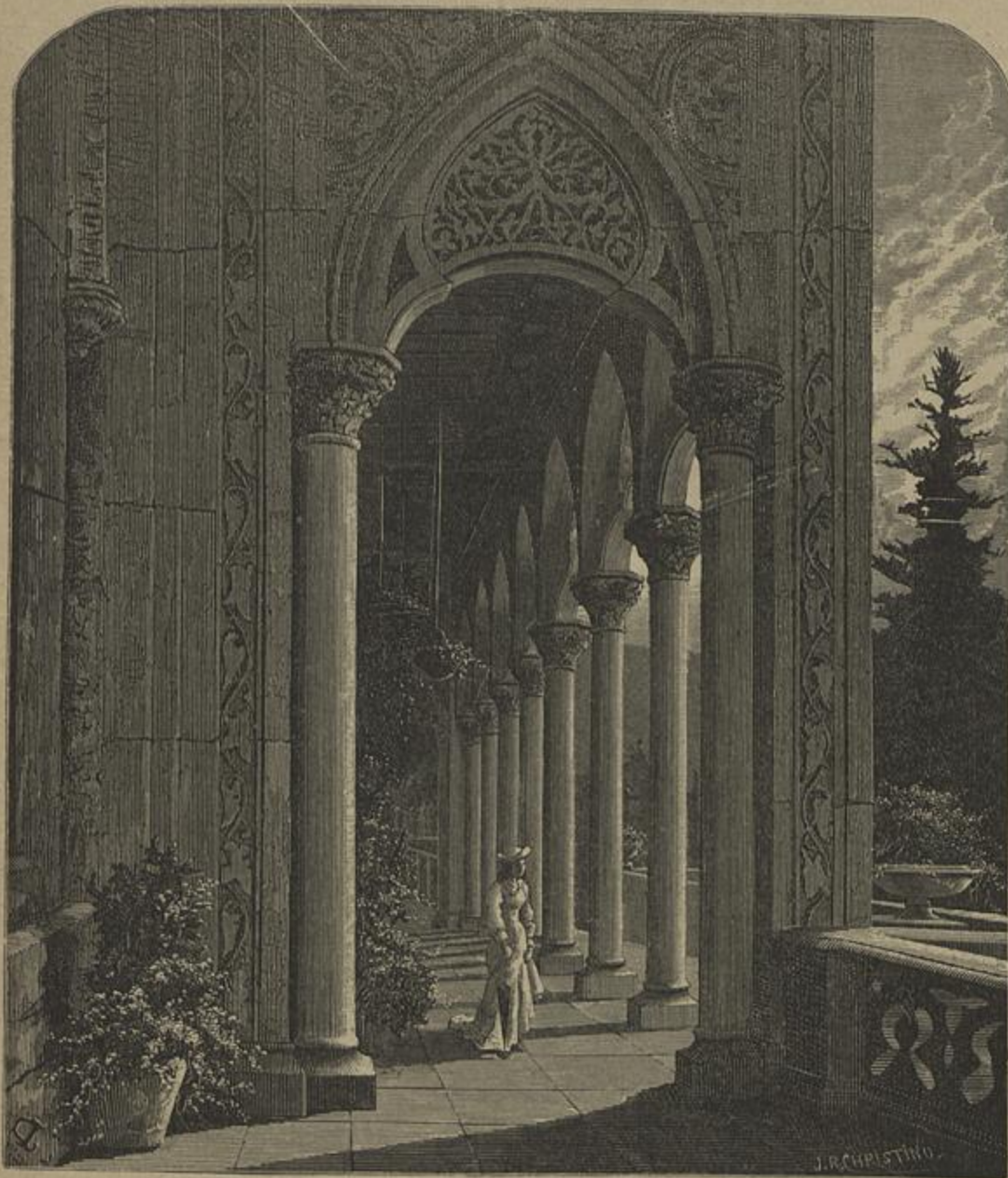
MONSERRATE — VISTA DA GALERIA EXTERIOR

Fantasma doloroso eram aquelles traços, E co'a carta me fui, d'alma feita em pedaços, Correr pela cidade, onde como ebrio andei, Perfume trepador não ha como a saudade. Busquei Ninon, mulher, atomo, claridade, Mas o seu doce encanto em vão, em vão, busquei!