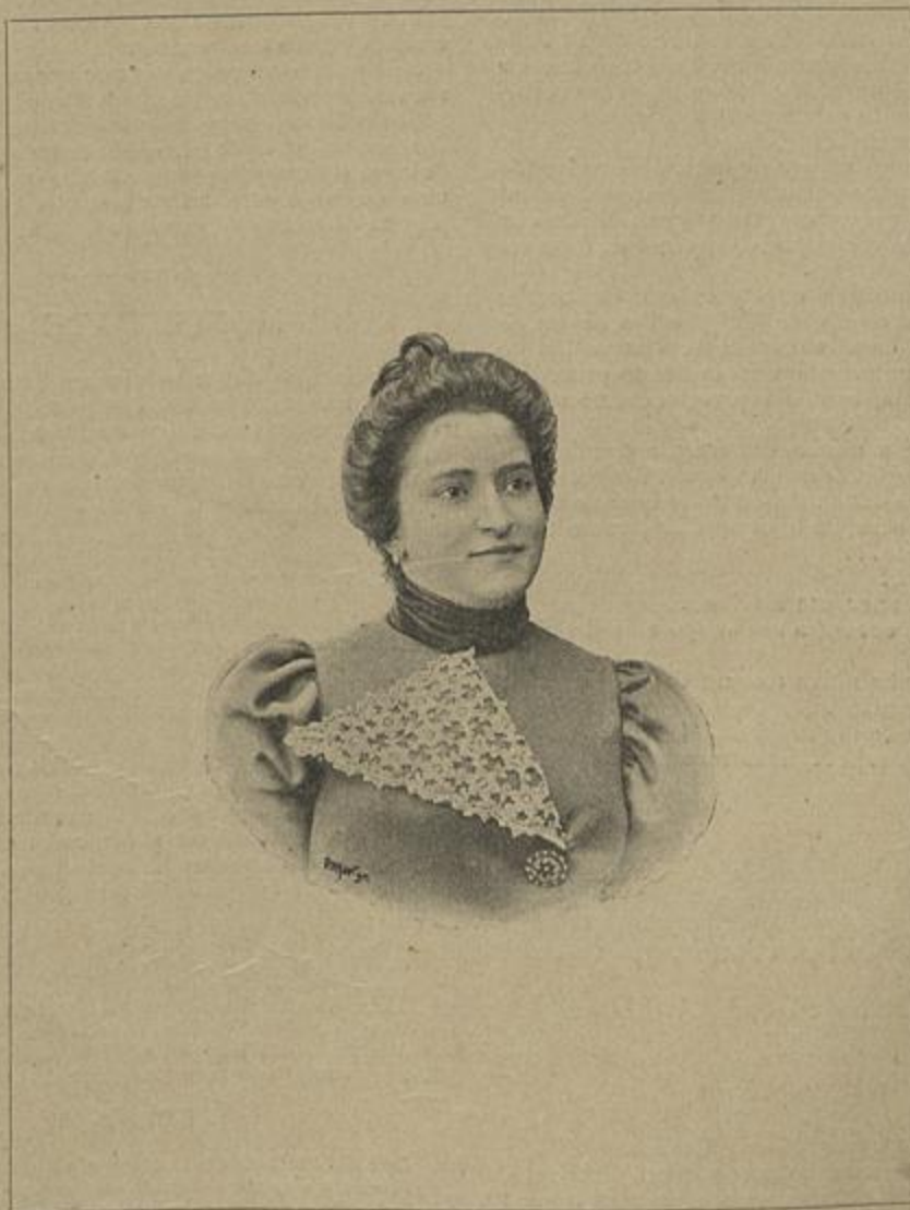
A ACTRIZ PALMIRA BASTOS