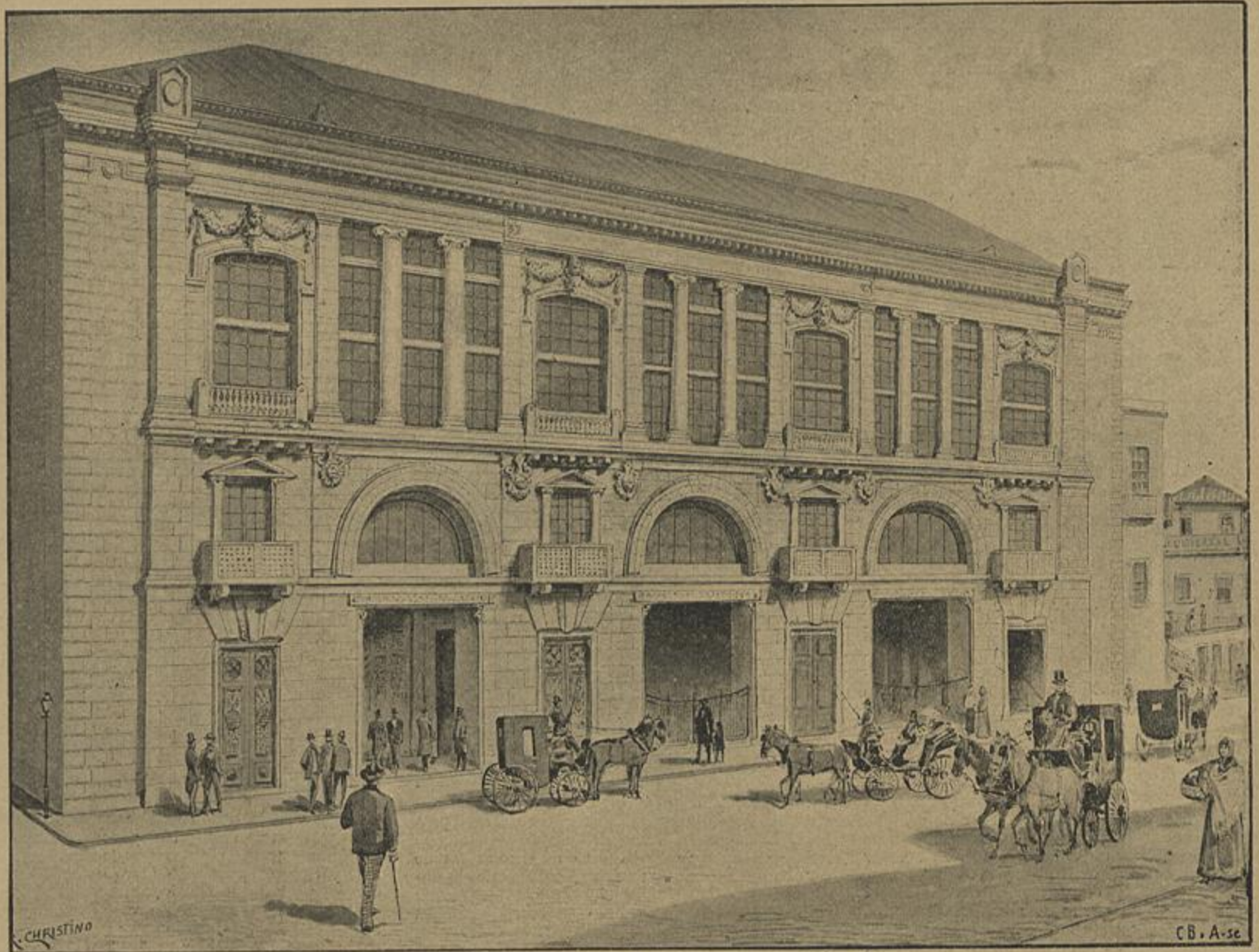
EDIFÍCIO DA SOCIEDADE DE GEOGRAPHIA DE LISBOA, NA RUA DE SANTO ANTÃO

Esta primeira refeição tinha o nome de «jenticulum.»