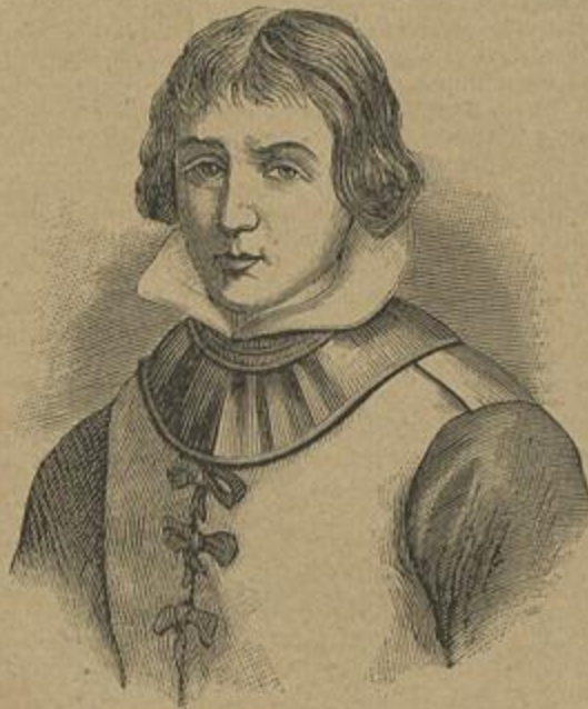
D. CATALINA DE ERAUSO — Vide Aventuras d'uma noviça