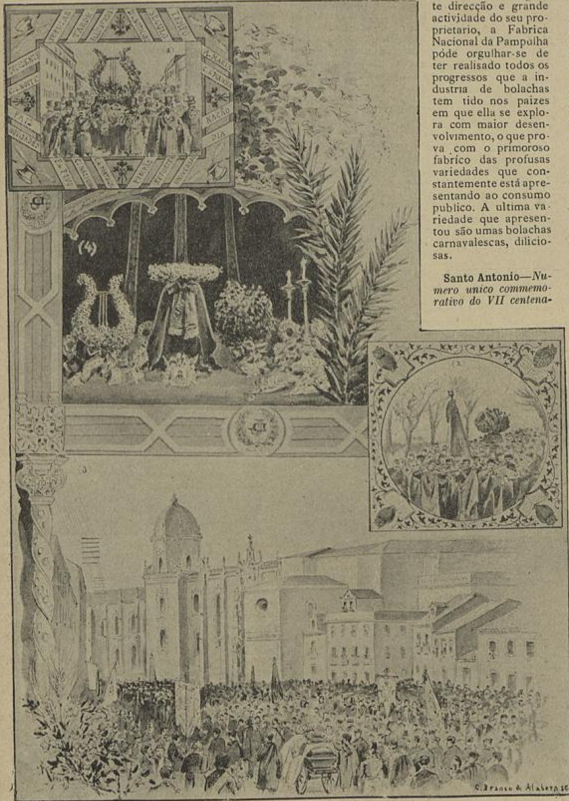
1 A IMPRENSA — 2 OS ESTUDANTES — 3 CHEGADA DO CORTEJO AOS JERONYMOS — 4 O CATAFALCO NOS JERONYMOS