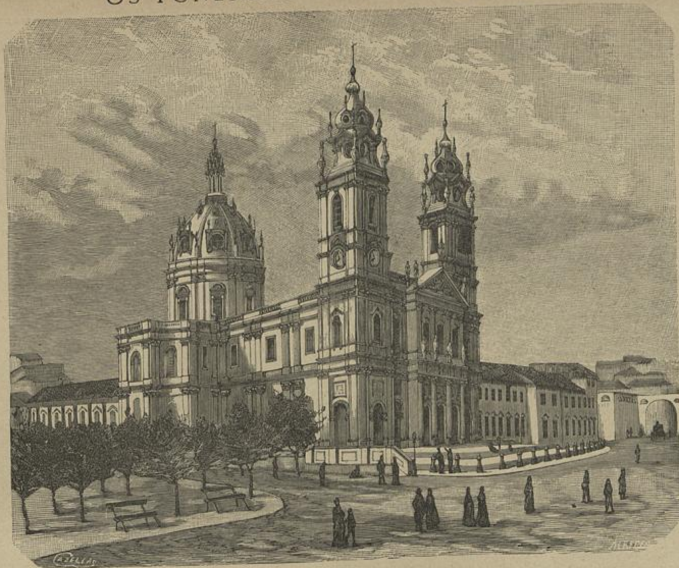
EGREJA DA ESTRELLA — ONDE ESTEVE DEPOSITADO O CORPO DE JOÃO DE DEUS