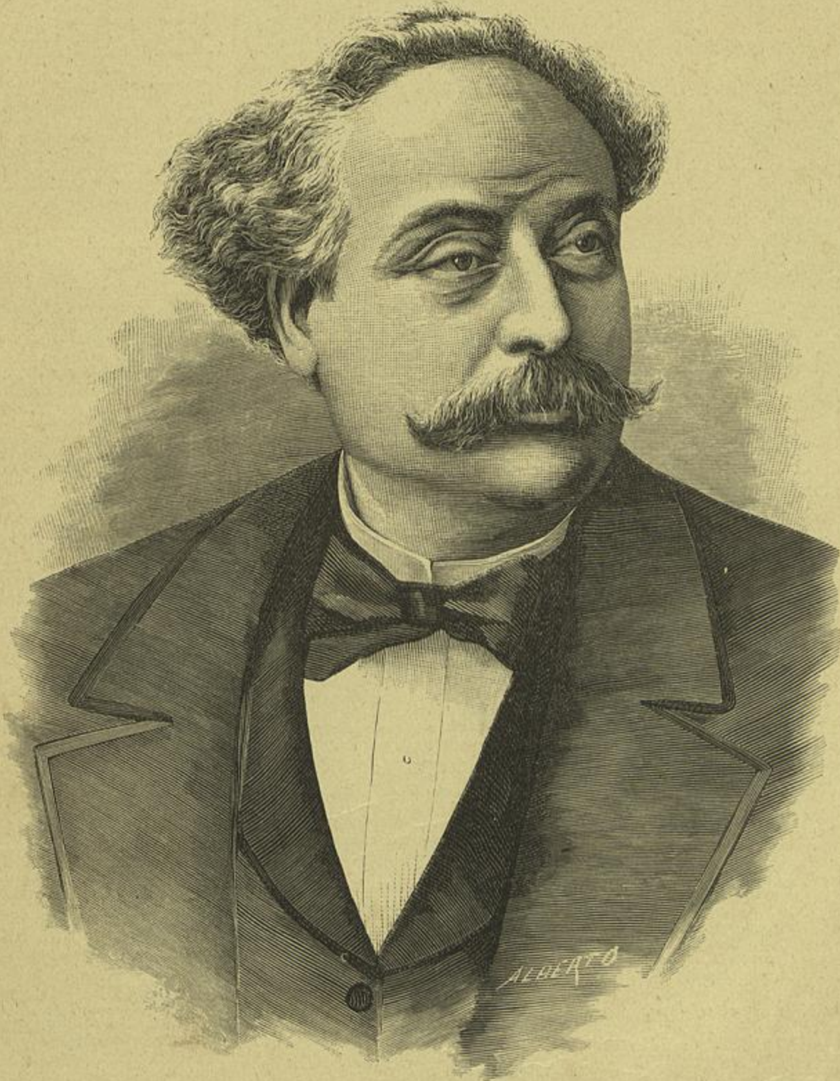
ALEXANDRE DUMAS — FALLECIDO EM 27 DE NOVEMBRO DE 1895 (Copia de uma photographia)