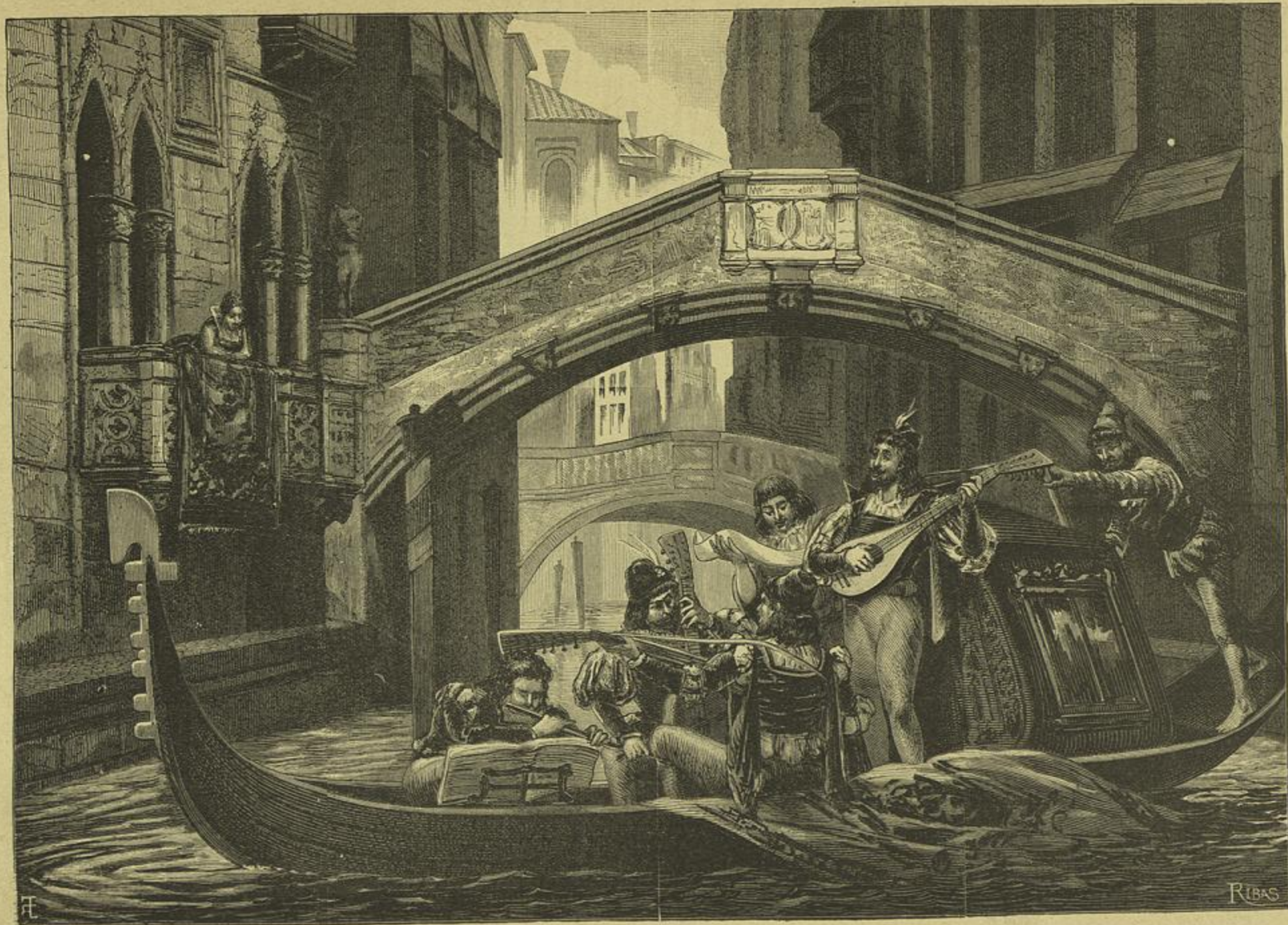
UMA SERENATA EM VENEZA