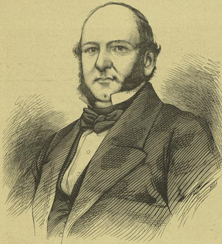
CONDE DA CARNOTA (Cópia de uma photographia)

rior, o Convento da Carnota foi primeiro povoado pelos frades da Ordem Franciscana, e só no século seguinte foi d'ella separado para, com algumas outras casas religiosas, servir de habitação aos frades que seguiam os preceitos mais asceticos do grande Thaumaturgo lisbo-nense.