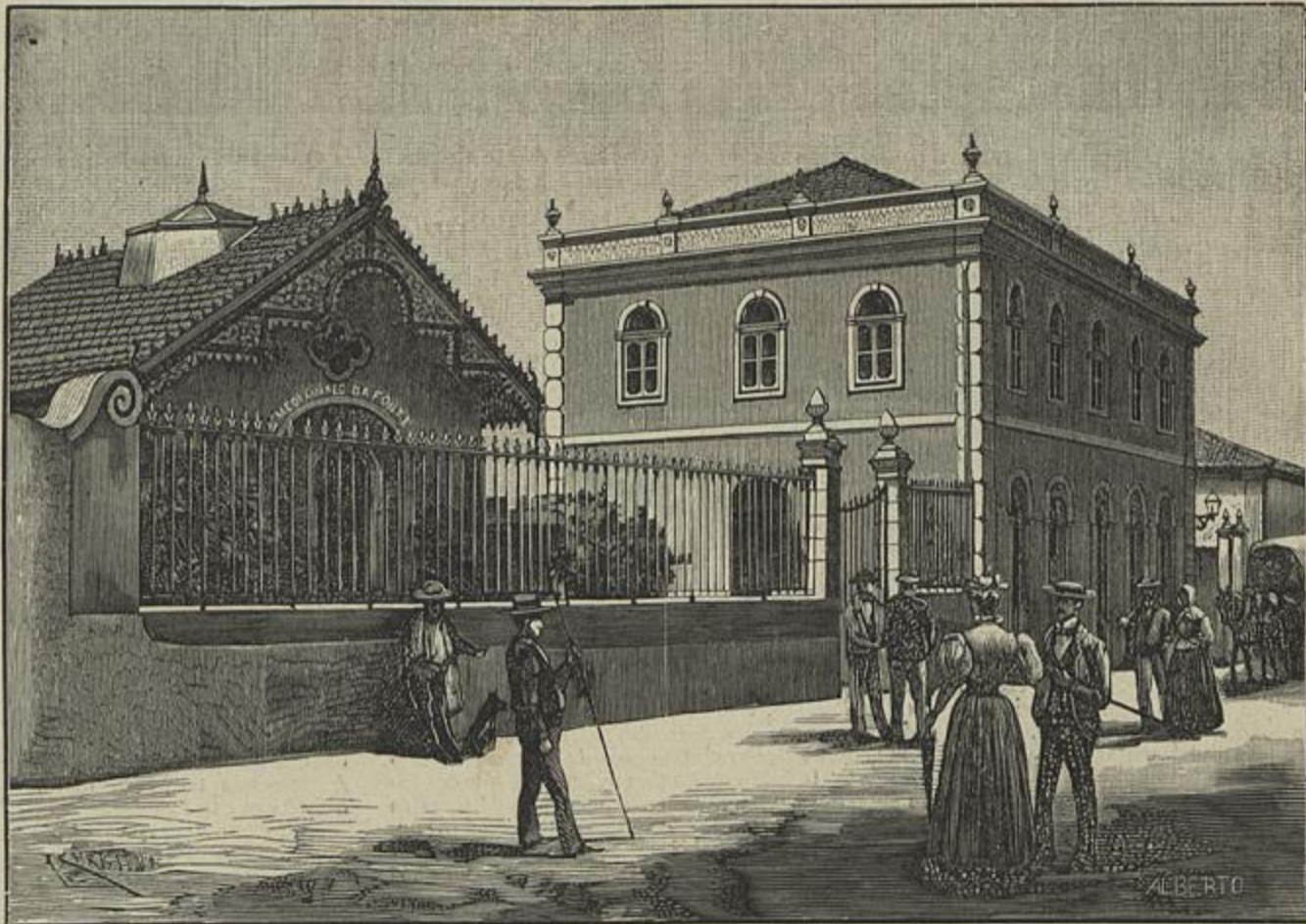
ESTABELECIMENTO DAS AGUAS DA FONTE NOVA EM TORRES VEDRAS—INAUGURADO EM 23 DE MAIO DE 1895

Sim, aquelle celebre dr. Sangrado, que tem feito rir as gerações, com o seu systema de curar todas as doenças com agua, já não é uma criação comica da imaginação de Lesage, mas o precursor da grande transformação por que havia de passar a therapeutica, que hoje encontra nas aguas o melhor remedio para todas as doenças, desde a Agua circassiana e Agua Florida, que nos rejuve-