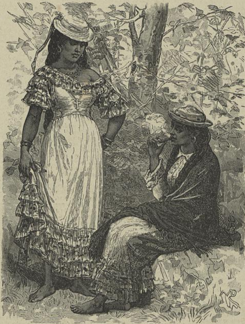
TYPOS DE MULHERES DA COLOMBIA

Temos recebido esta publicação, a qual já vae no seu n. o 15. E' bem redigida e variada nas suas secções publicando artigos de interesse.