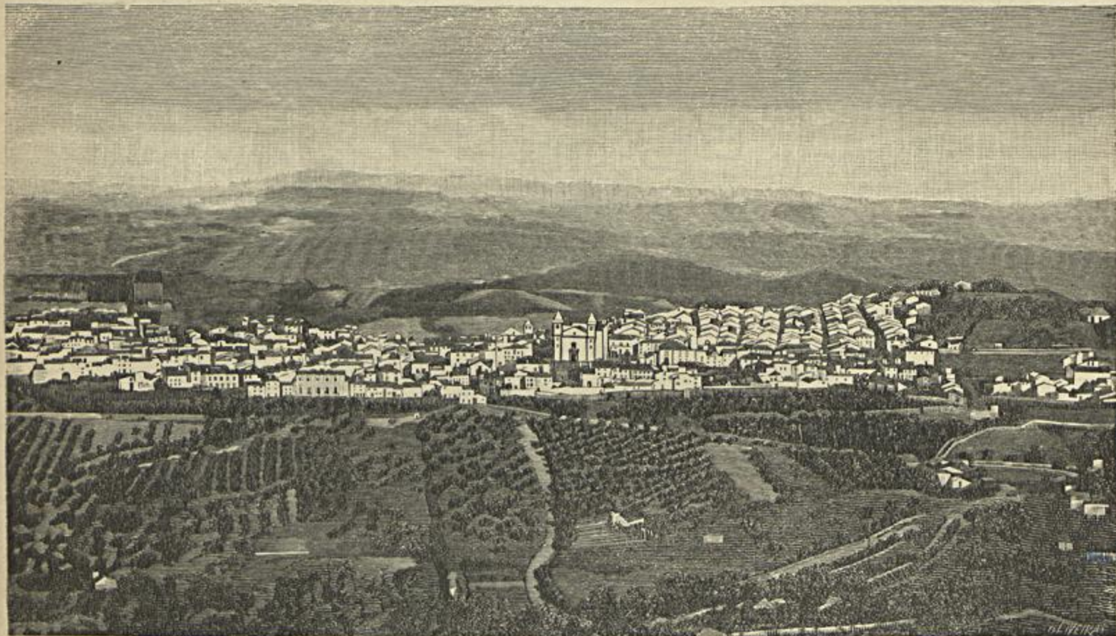
VISTA GERAL DE CASTELLO DE VIDE — Vide art. OITO DIAS NO ALEMTEJO