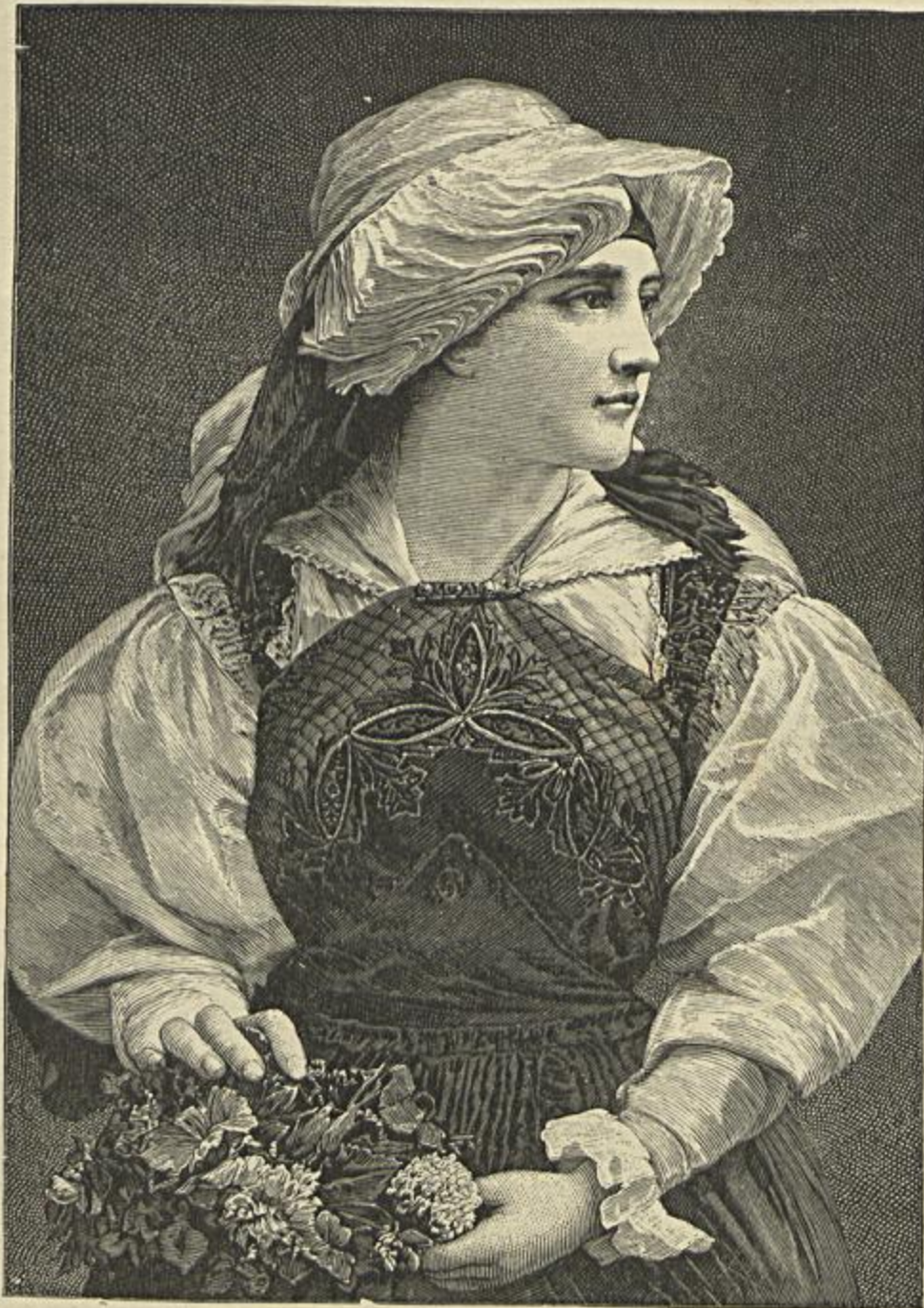
COSTUMES DA BULGARIA — UMA ALDEÁ

A segunda parte d'este relatorio insere documentos relativos a interferencia da Associação em varias questões de interesse para o commercio, junto dos poderes publicos, etc.; concluindo com a relação dos socios effectivos em numero de 630, e com uma estatistica do movimento commercial do Porto, em 1891, e sua comparação com o movimento dos annos anteriores.