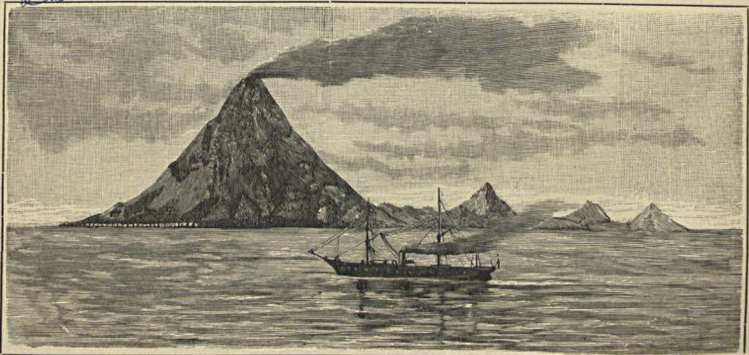
O VULCÃO GUNONA AVÚ NA PARTE NOROESTE DA ILHA ANTES DE AFUNDAR-SE NO OCEANO