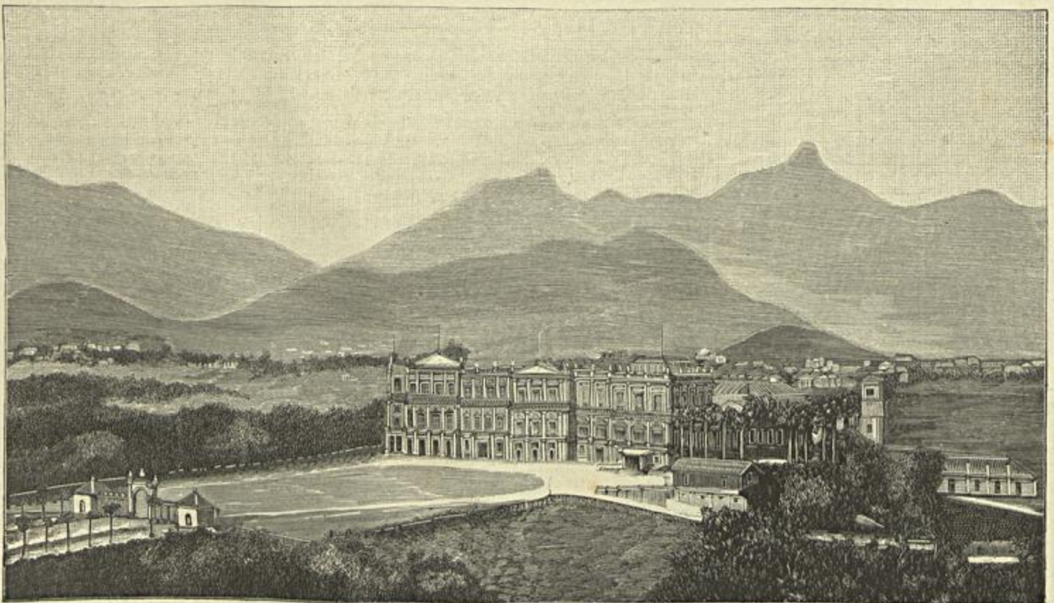
BRAZIL. — O PALACIO DA BOA VISTA — ARREDORES DO RIO DE JANEIRO — ANTIGA RESIDENCIA DE VERÃO DO EX-IMPERADOR D. PEDRO II