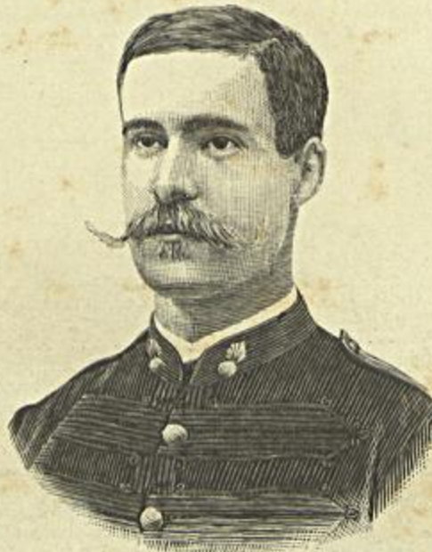
O CAPITÃO COUCEIRO