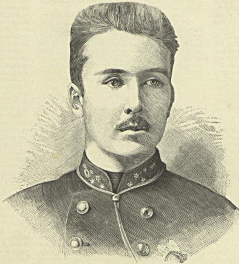
O PRINCE BALDUINO LEOPOLDO FILIPPE DE FLANDRES