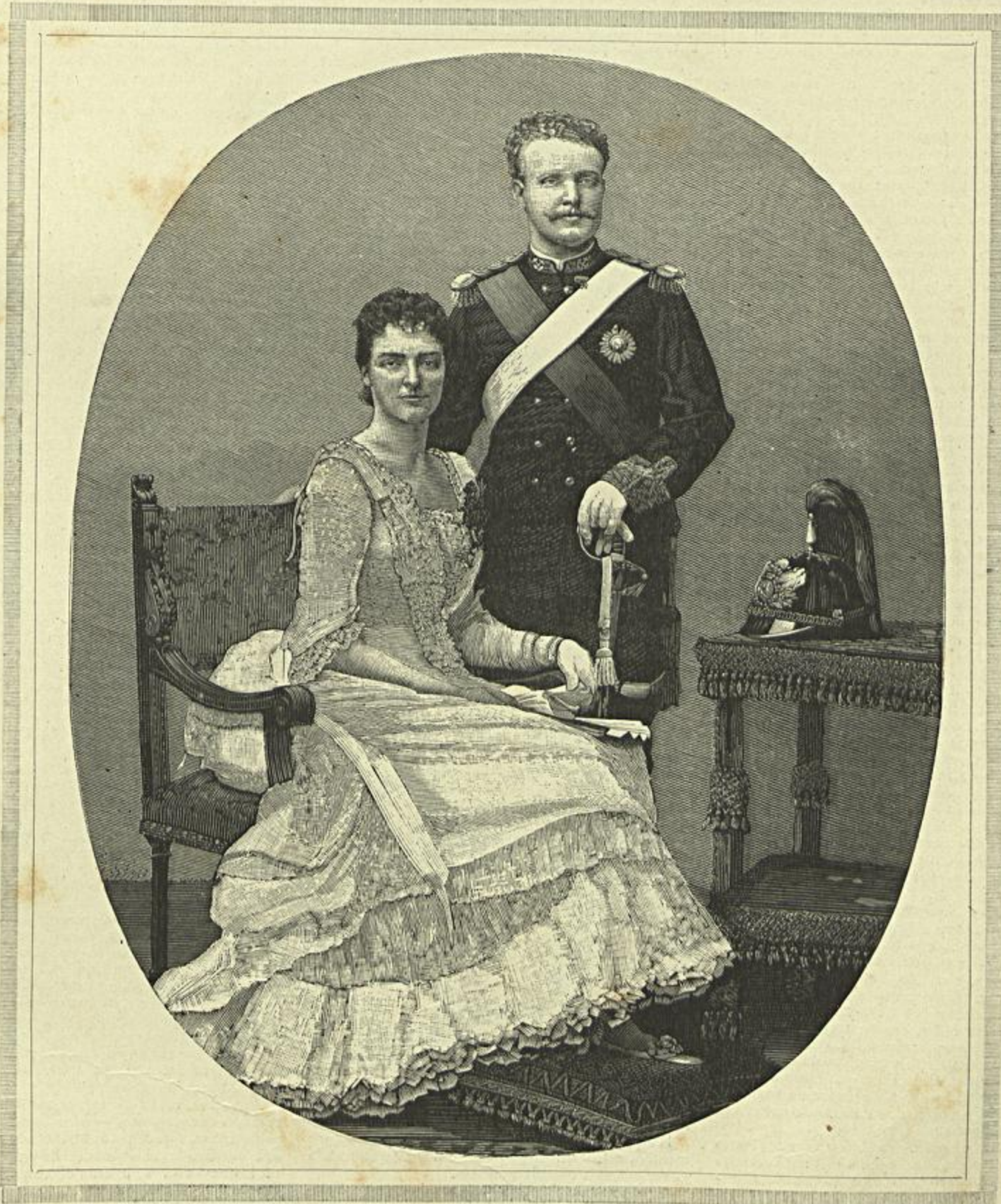
SUAS Magestades EL-REI D. CARLOS E RAINHA D. MARIA AMELIA