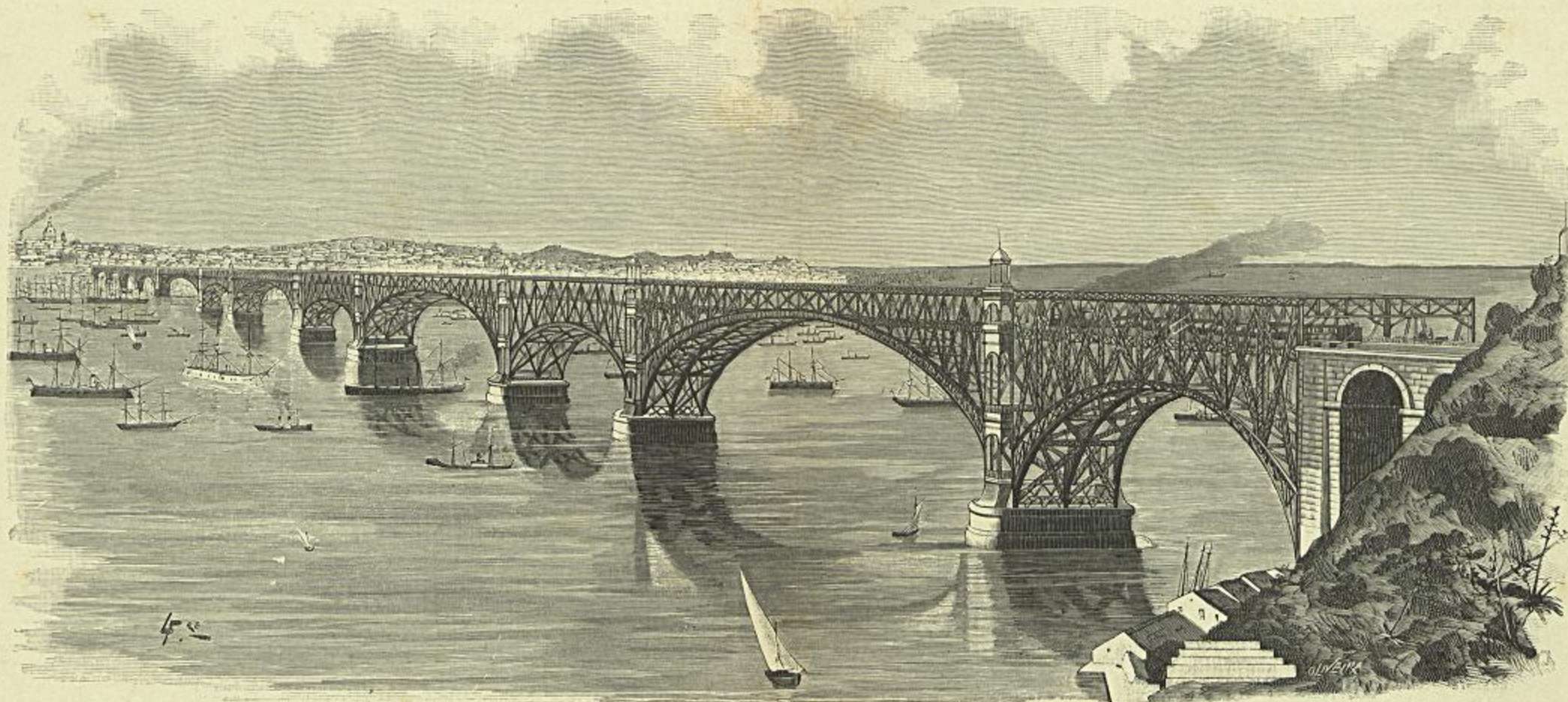
PONTE SOBRE O TEJO ENTRE LISBOA E ALMADA

CONFORME O PROJECTO DOS SRS. E. BARTISSOL E T. SEYRIG