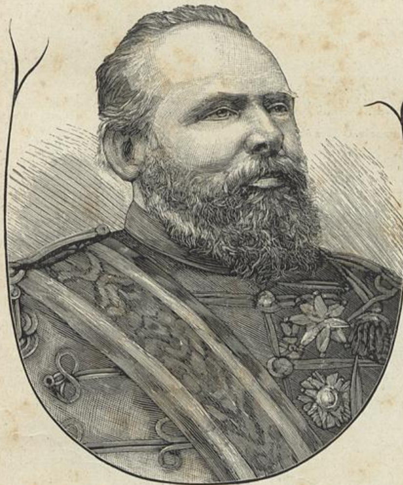
S. M. O REI GUILHERME III