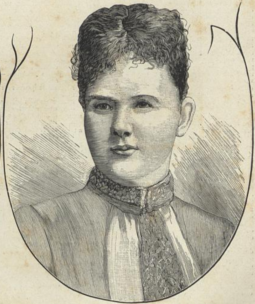
S. M. A. RAINHA EMMA, REGENTE

triste para as letras, para quem elle era um disvelado cultor, noticia triste para nós, que ha muitos annos o tivemos por mestre, que ha muitos annos o tinhamos por amigo.