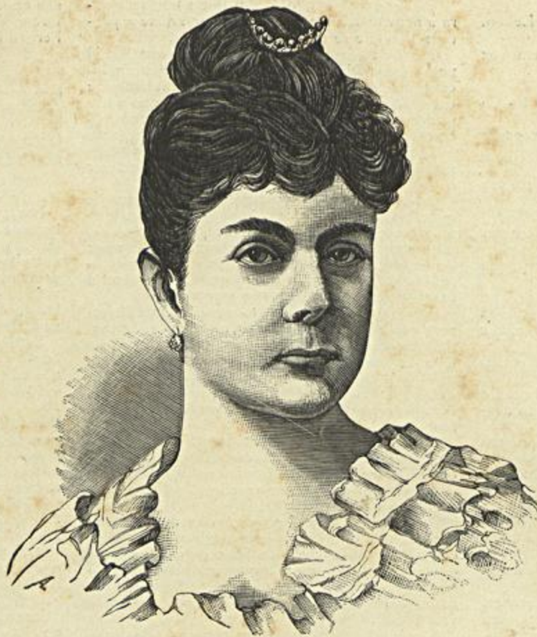
A BARONEZA MARIA VETSERA