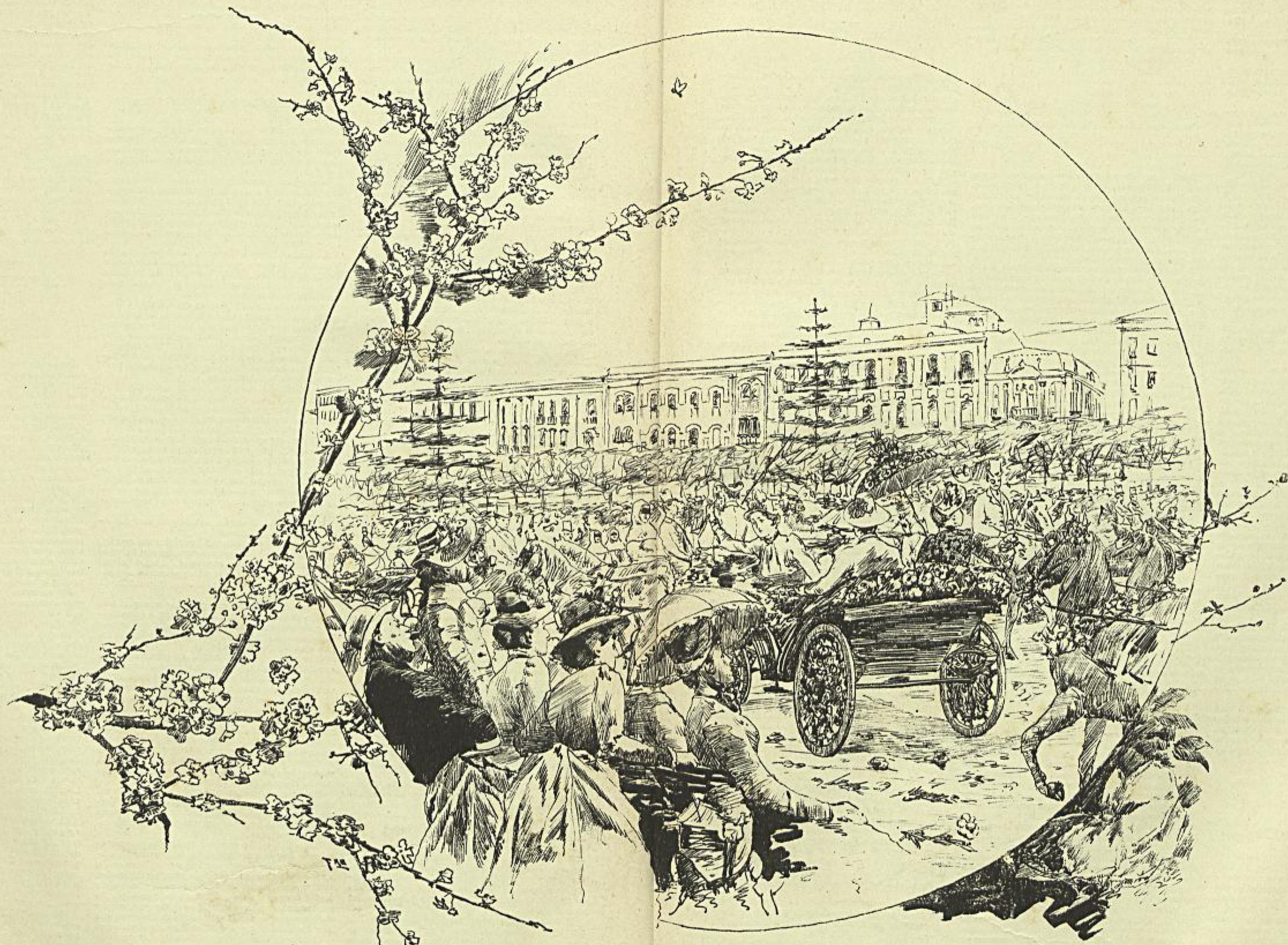
O CARNAVAL DE 1889, EM LISBOA — A BATALHA DAS FLORES NA AVENIDA DA LIBERDADE — VID. CHRONICA OCCIDENTAL