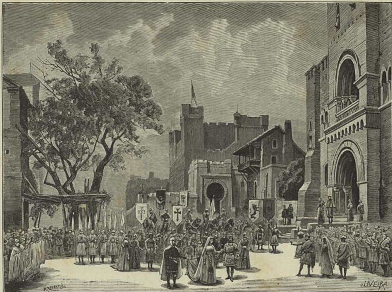
«DONA BRANCA» OPERA DE ALFREDO KEIL. — 1.º ACTO, SCENA DA ENTRADA DE DONA BRANCA — Vid. artigo Alfredo Keil