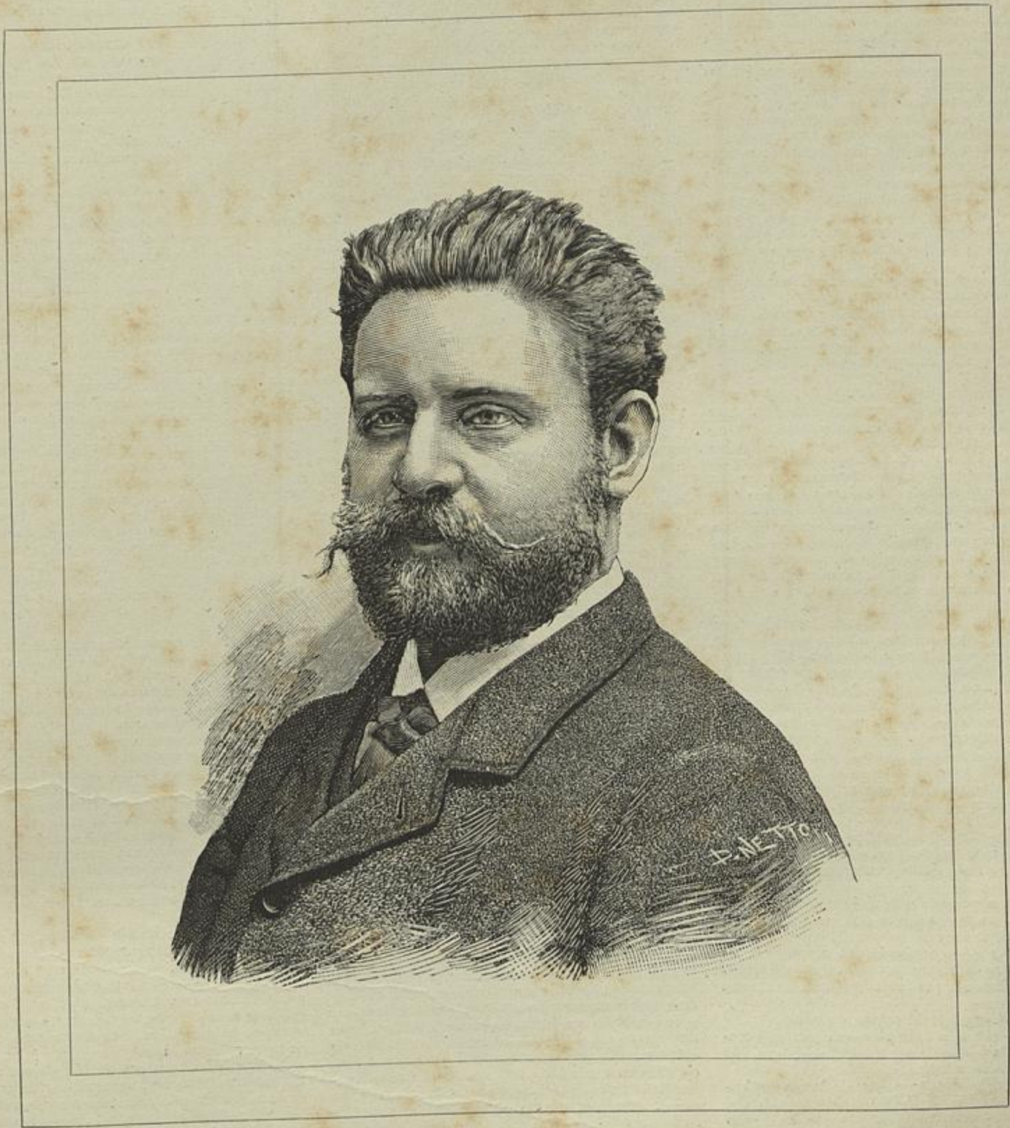
O MAESTRO ALFREDO KEIL, AUCTOR DA OPERA «DONA BRANCA»