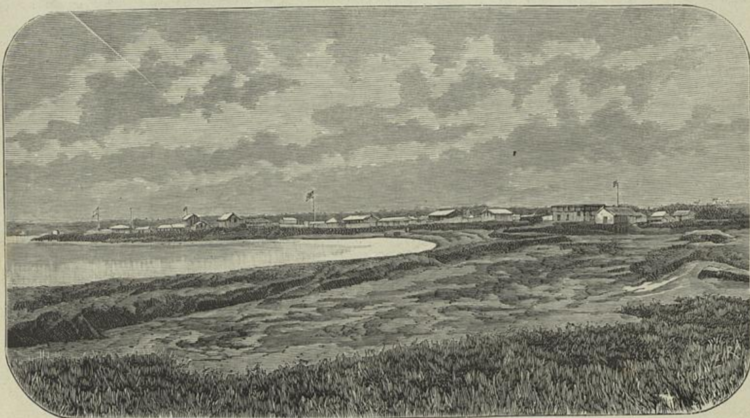
AFRICA PORTUGUEZA — AMBRISSETTE, OCCUPADO PELA AUCTORIDADE PORTUGUEZA, EM 22 DE JANEIRO DE 1888

E, na sua familiaridade brincalhona, todas a desafiavam