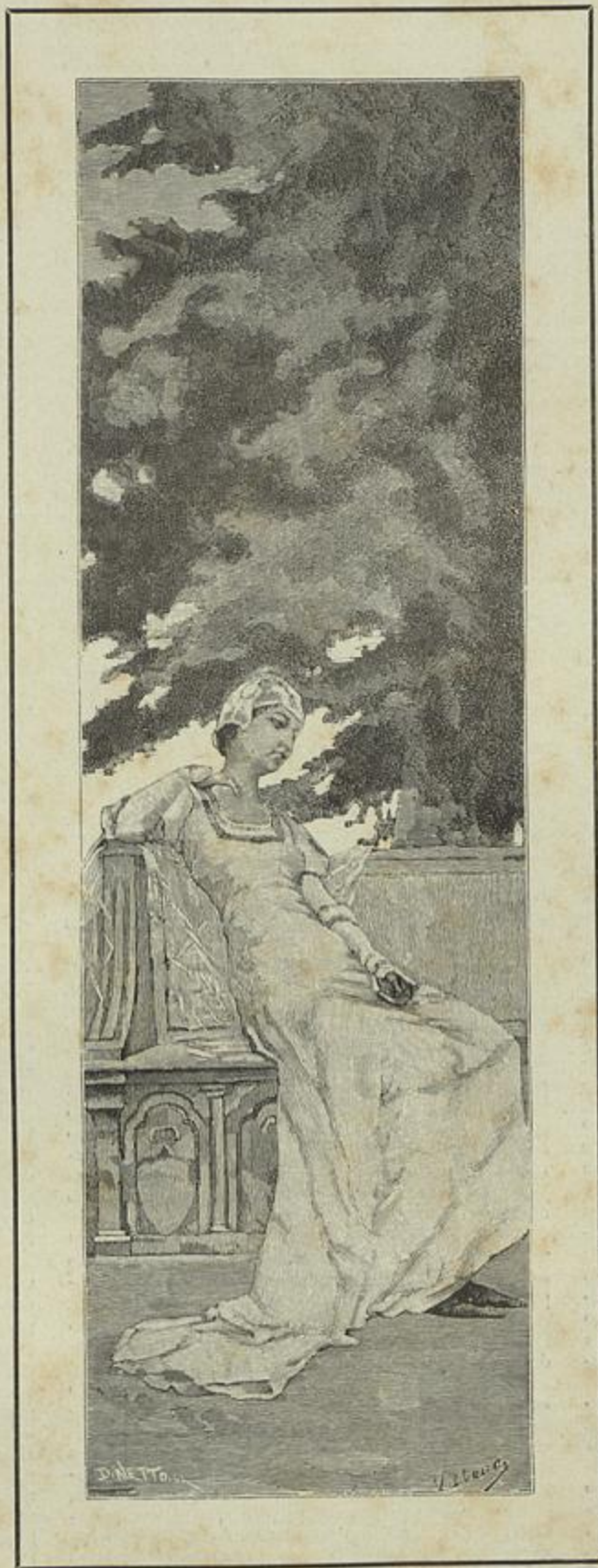
IGNEZ DE CASTRO