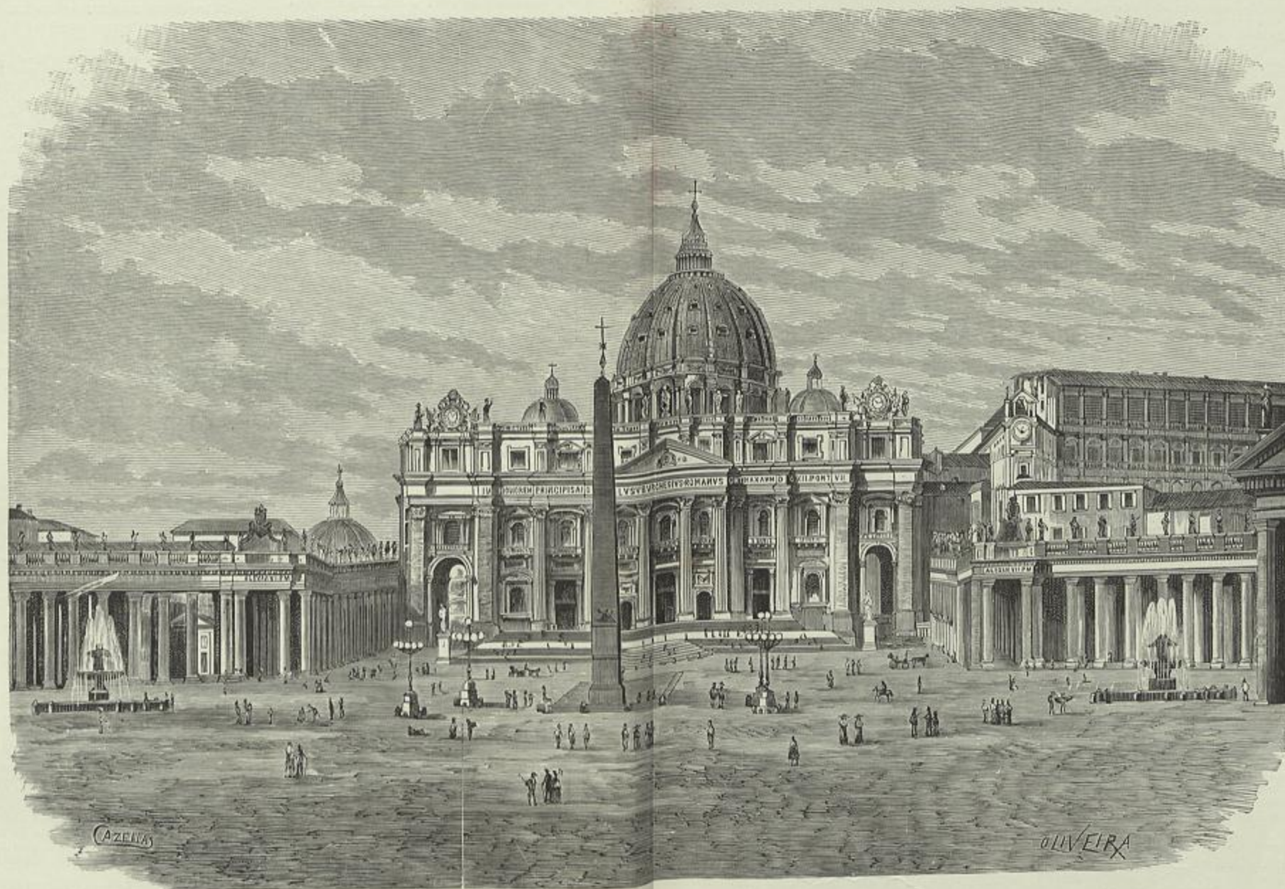
A BASILICA DE S. PEDRO, EM ROMA