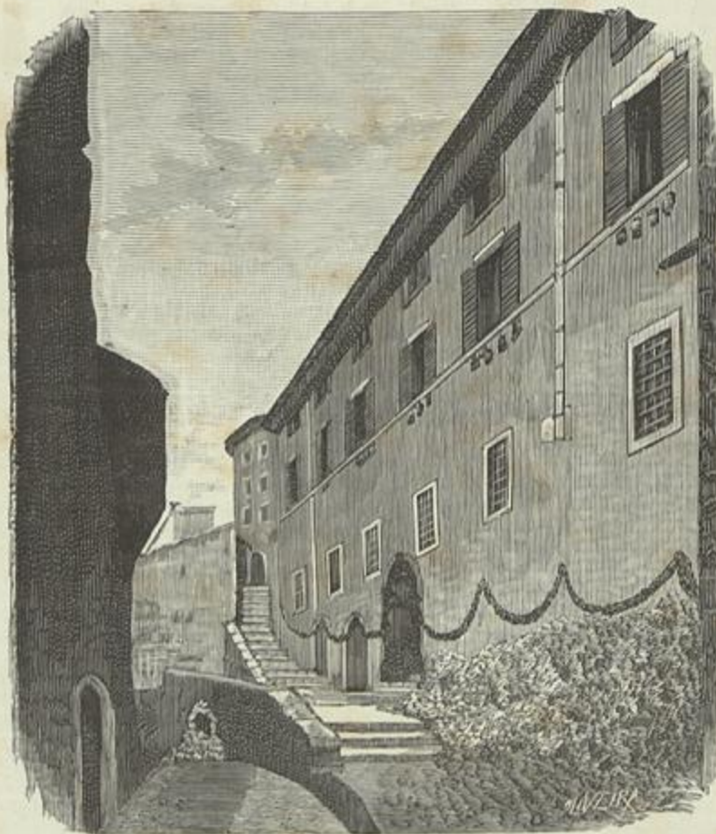
CASA ONDE NASCEU LEÃO XIII, NA VILLA DE CARPINETO

ver se devem ser recolhidas ao museu estas pedras e capiteis.