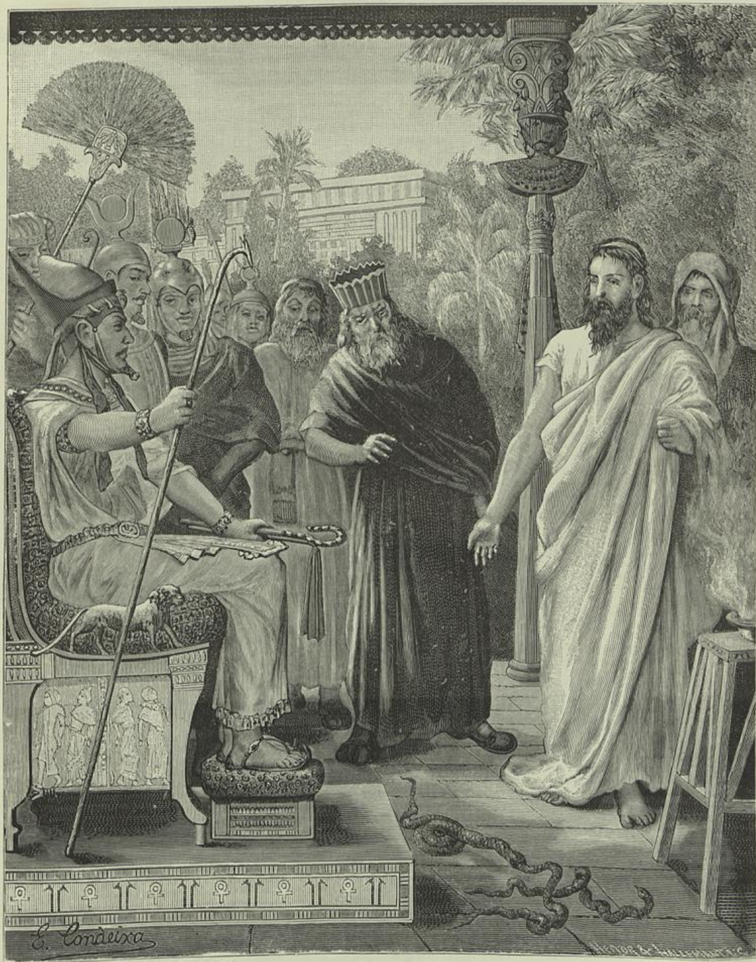
A VARA DE ARÃO TRANSFORMADA EM COBRA

(Composição e desenho de Ernesto Condeixa)