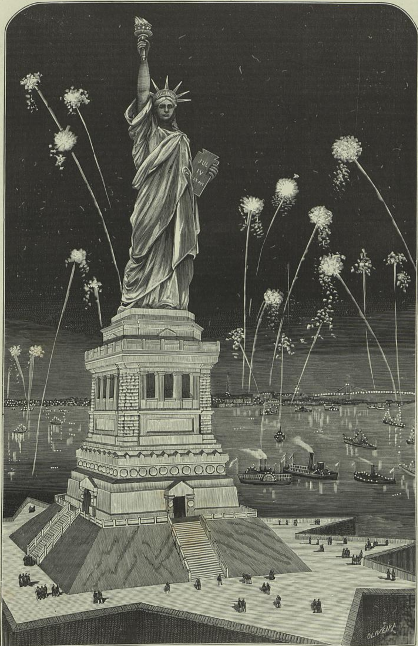
INAUGURAÇÃO DA ESTATUA DA LIBERDADE, ILLUMINANDO O MUNDO, Á ENTRADA DO PORTO DE NEW-YORK, 28 DE OUTUBRO DE 1886