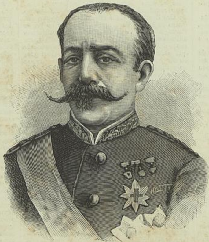
O BRIGADEIRO VILLACAMPA

Boletim da Sociedade de Geographia de Lisboa, fundada em 1875, Lisboa, Imprensa Nacional, 1885. — 5.ª serie, n.ºs 11 e 12, reunidos em um fasciculo, encerra elle, além das actas do