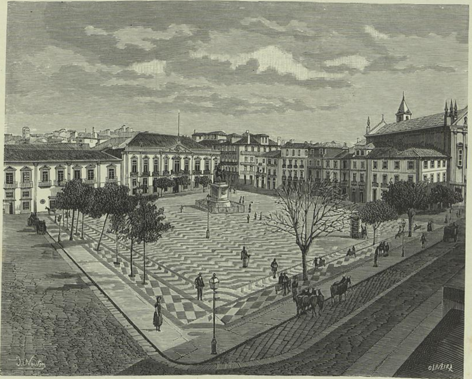
A PRAÇA DE D. PEDRO, NA CIDADE DO PORTO (Segundo uma photographia de E. Biel)

Em toda a parte, e entre nós não é isso extranho, antes é constantissimo, os serviços nocturnos retribuem-se pelo dobro dos diurnos; pois na bibliotheca nacional não o são nem pela millesima, quanto mais pelo dobro. O empregado acaba o serviço de dia ás 4 horas da tarde, sae da repartição ás 4 e meia, e quando tem serviço nocturno, que para uns é um dia sim um dia não, para outros de dois em dois, ou de trez em trez, tem que ir a correr a casa, jantar á pressa, vir de novo a correr até á bibliotheca, porque ás 7 ha de estar aberta. Imagine-se quem mora á Estrella, ao Campo de Santa Anna, a Santos, a Arroios, ao Castello