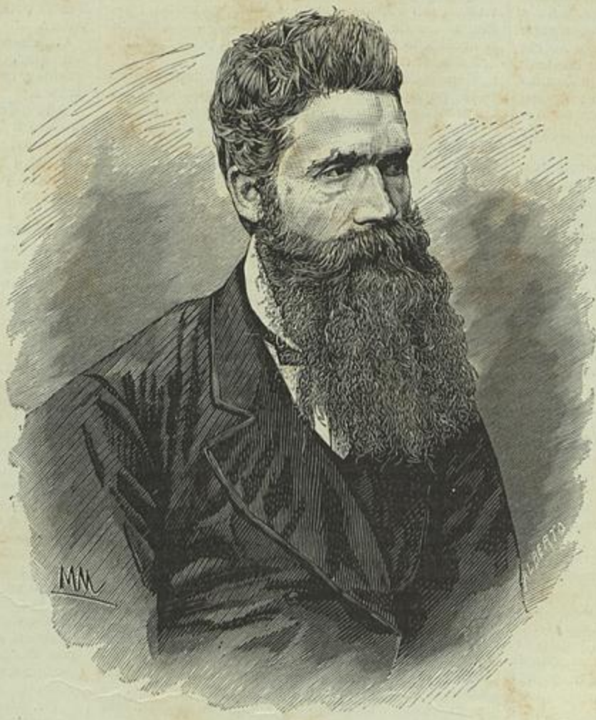
ANTONIO SOARES DOS REIS, PROFESSOR DE ESCULPTURA DA ACADEMIA PORTUENSE DE BELLAS-ARTES