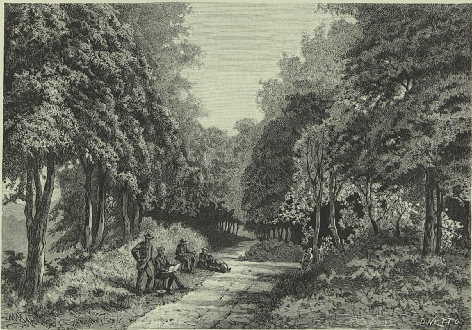
A CAVA DE VIRIATO, EM VIZEU