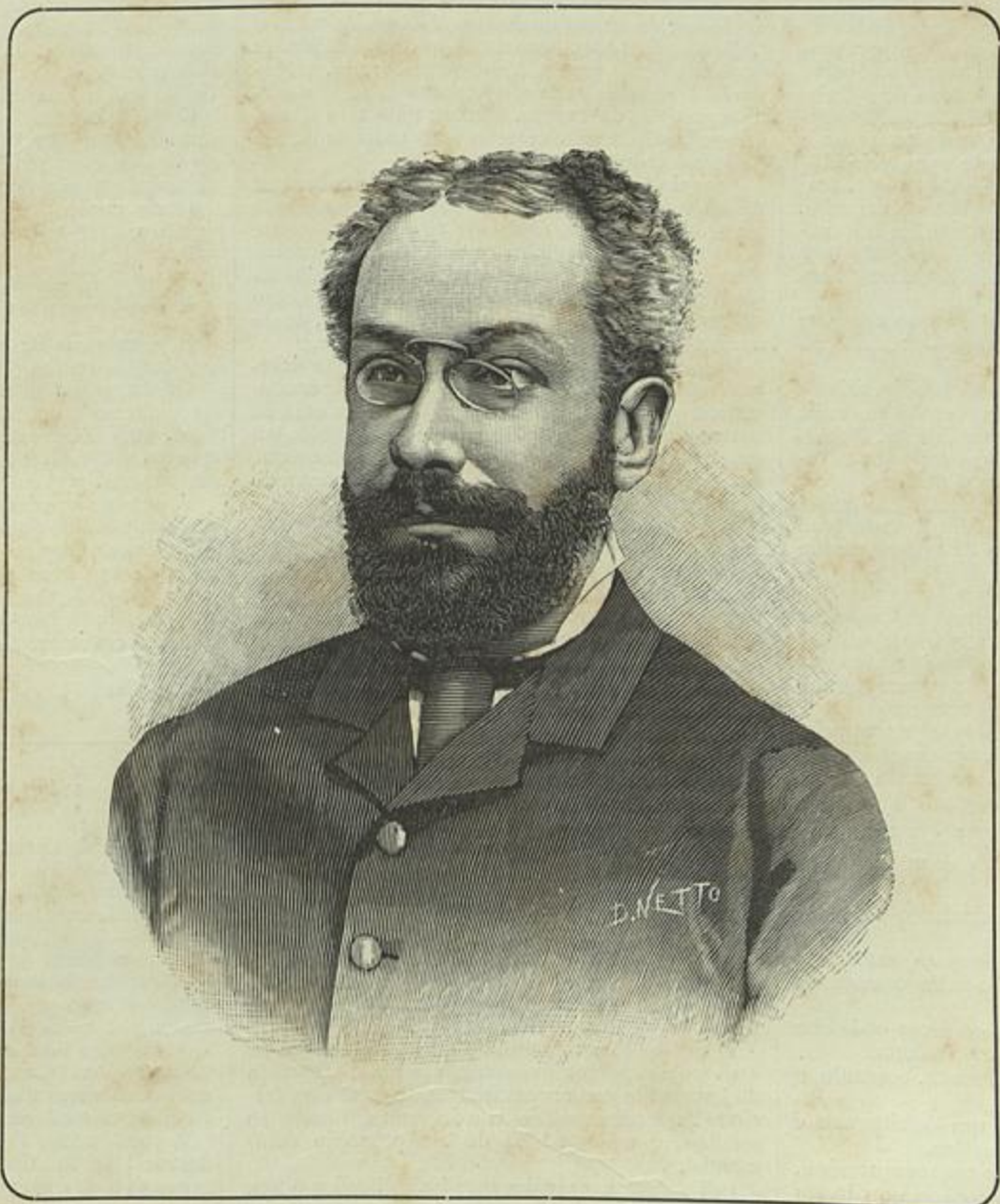
ANTONIO ENNES — BIBLIOTHECARIO-MÓR DA BIBLIOTHECA PUBLICA DE LISBOA (Segundo uma photographia de Fillon)

Esse assumpto porém é que tinha o seu perigo por muito parisiense e um bocadinho picante.