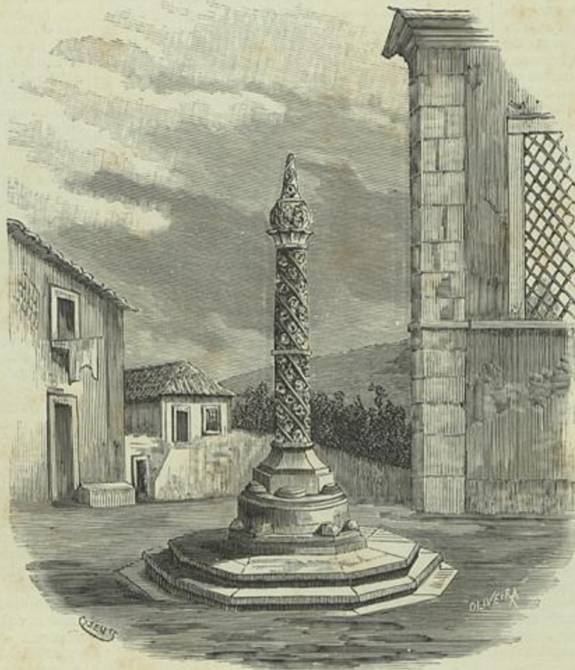
PELOURINHO DA VILLA DE COLLARES (Desenho do natural por Cazellas)

Revista de medicina militar, director Eugenio Augusto Perdigão. — Porto, Typographia Elzeviriana, rua do Bomjardim, 190, 1886. — Primeiro fasciculo, 1 de outubro de 1886. — Começou no 1.º do mez passado a sua publicação, no Porto, este novo orgão da medicina militar. Já tinhamos em Lisboa, a Gazeta dos hospitaes militares , e o novo campeão, vem juntar os seus esforços aos do periodico lisbonense. Desejamos-lhe longa vida. Pelo summario do que