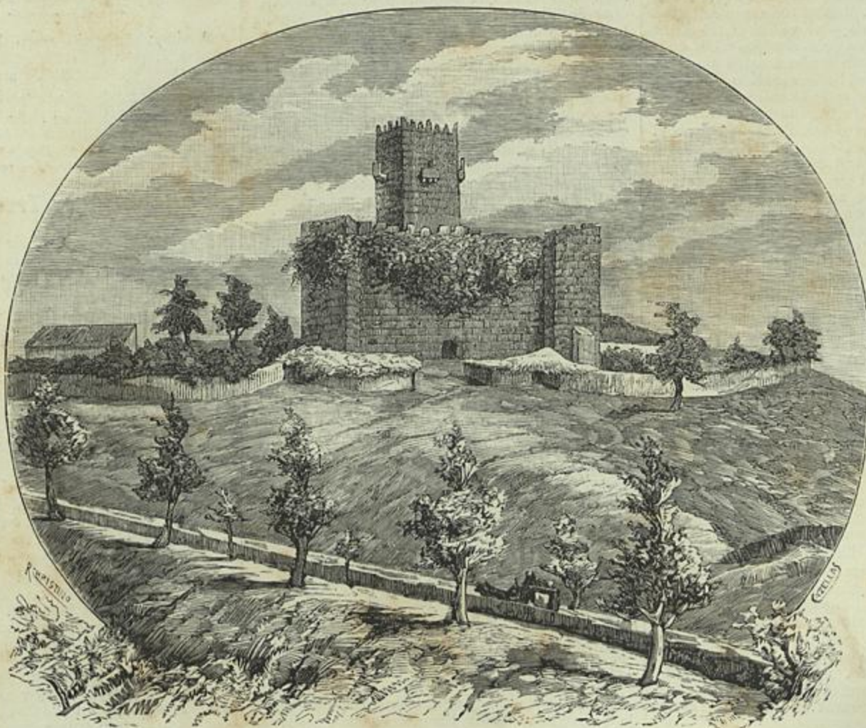
CASTELLO DO SABUGAL. (Desenho do natural por Abel Acacio)

Ora tudo isto, uns dias magnificos a adivinharem outomno, um ar excellente cortado de todos os lados por montanhas enormes, e purificado por arvoredos gigantescos, esplendida agua, hotel com as commodidades que o hospede mais exigente