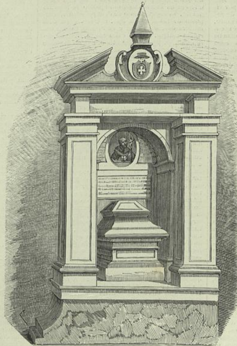
TUMULO DE FREI BARTHOLOMEU DOS MARTYRES, NA EGREJA DO EXTINCTO CONVENTO DE SANTA CRUZ, EM VIANNA DO CASTELLO

nandreas , flôres hermaphroditas, perigonio irregular hexaphyllo, dispostos em espiga, racymo ou solitarias. Estames coadunados ao estylete. Ovario infero. Capsula polysperma. Familia das Orchideas . Ordem das Scitamineas . Flôres hermaphroditas ou polygamas, perigonio henaphyllo irregular ou calix trimero e corolla hexamera, em racymo, espiga ou espadice. Estames livres, ovario infero. Fructo capsular, ou baga ou drupa, polyspermo. Familia das Musaceas . Ordem das Coronareas . Flôres hermaphroditas, perigonio hexamero quasi sempre regular em espigas, racymos, umbellas, cymos, paniculas ou solitarias. Estames 6 livres ou monadelphos. Ovario no maior numero supero. Capsula ou baga polysperma. Familia das Juncaceas , Aphyllanthaceas , Colchicaceas , Dioscoreaceas , Smilaceas e Liliaceas . Ordem dos Principes ou Palmeiras . Flôres diclinas, de perigonio hexamero regular collocadas em espacides racymosos. Estames muitos monadelphos. Ovario supero. Drupa ou baga mono ou trisperma. Folhas grandes reunidas em coma terminal. Familia das Palmas ou Palmeiras .