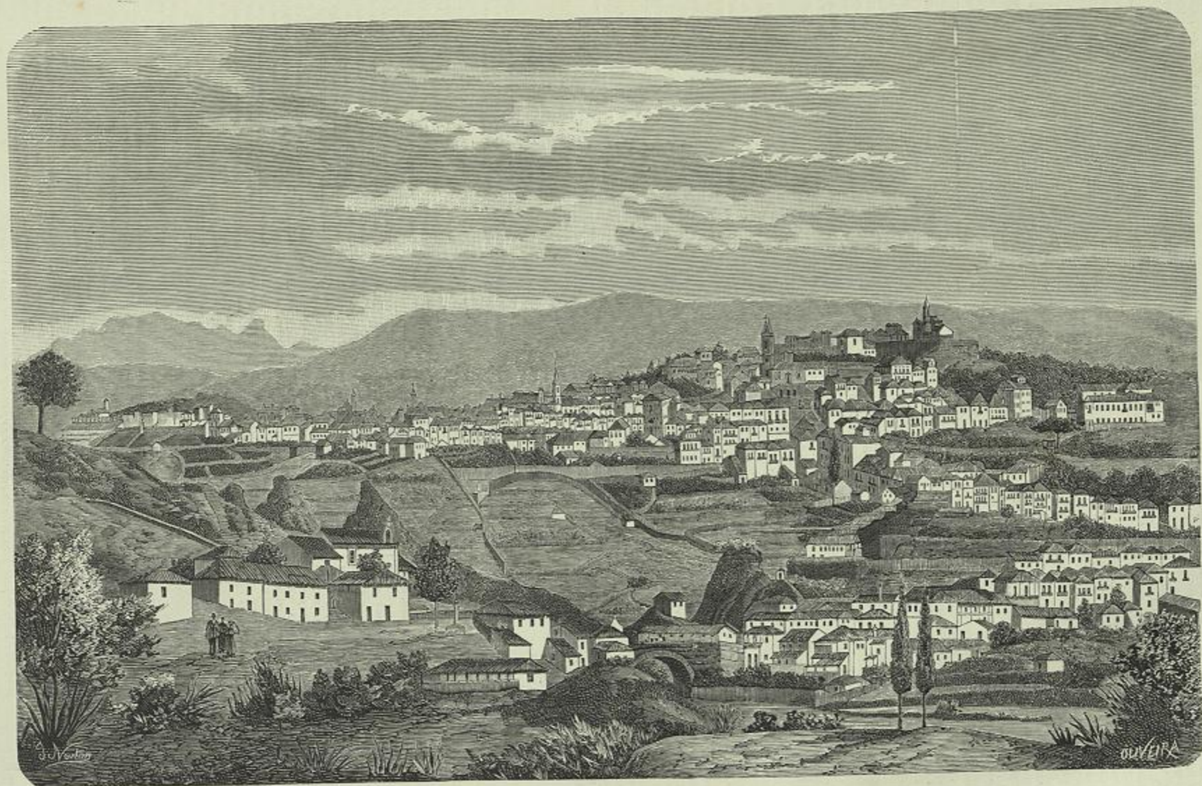
VILLA REAL DE TRAS-OS-MONTES (Desenho do natural pelo artista amador sr. Lopes Mendes)