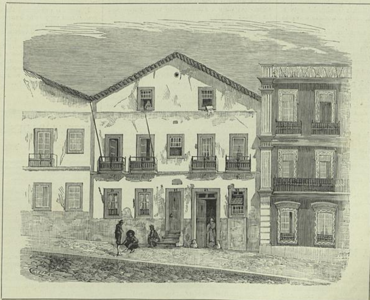
CASA ONDE MORREU O POETA NICOLAU TOLENTINO DE ALMEIDA (Desenho do natural por Cazellas)