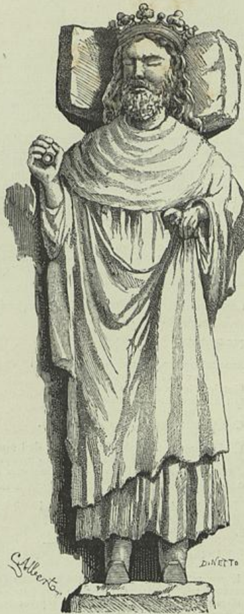
ESTATUA TUMULAR DE EL-REI D. DINIZ (Desenho do natural por C. Alberto)

e selvageria. E que vergonha para nós, portugueses, que nos ufamamos da nossa civilização, se alli for um estrangeiro, e observar aquelles repugnantes emplastros, e as proprias mutilações da estatua do rei-lavrador!