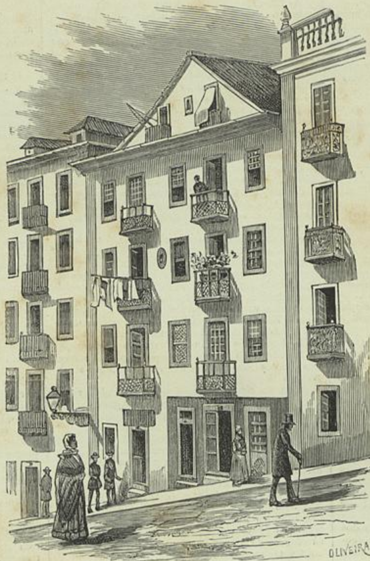
CASA ONDE NASCEU O POETA NICOLAU TOLentino DE ALMEIDA