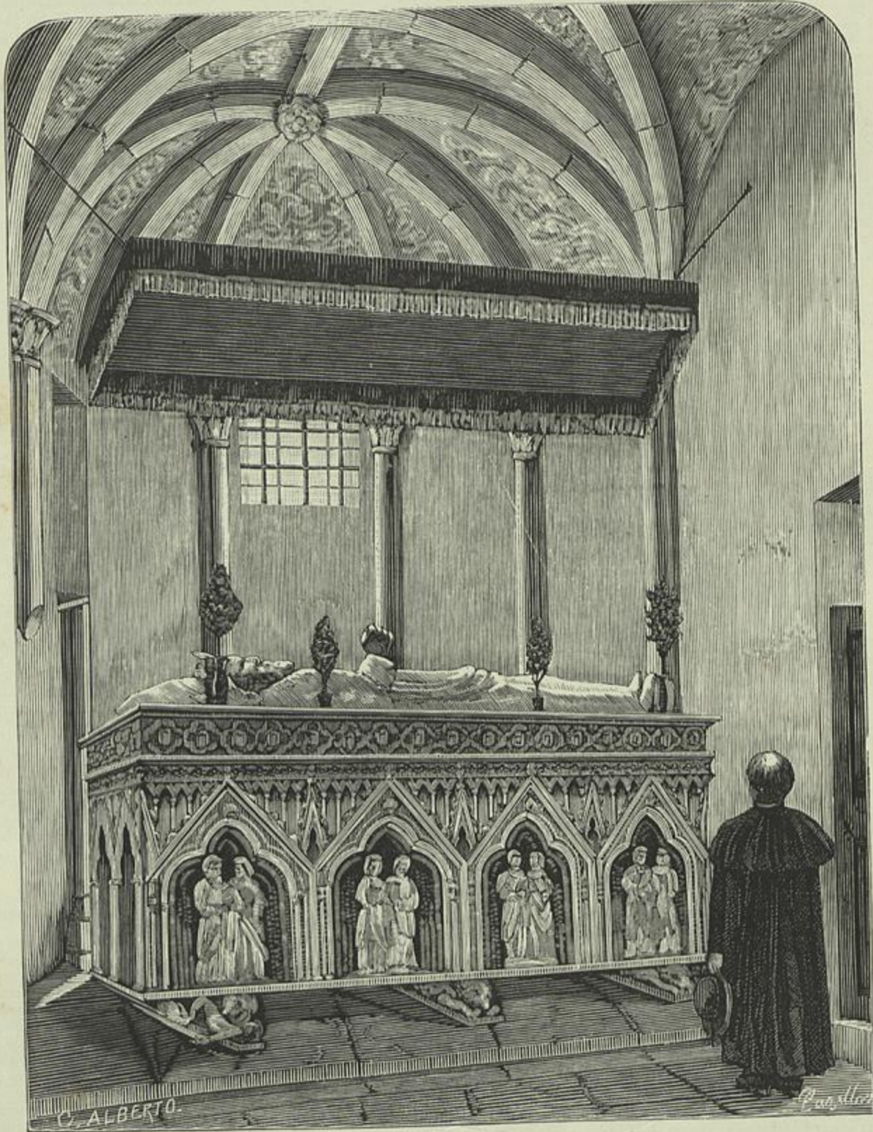
TUMULO DE EL-REI D. DINIZ, NO CONVENTO DE ODIVELLAS (Desenho do natural por C. Alberto)

pitulo III. A terceira e ultima reconstrucção foi em resultado da destruição causada pelo terramoto do 1.º de novembro de 1755. A capella-mór ficou illeza interiormente, mas no exterior padeceu grande ruina. No corpo da igreja abateu uma grande parede da abobada de laçaria de pedra das suas tres naveas. Como a ruina da capella-mór apenas prejudicava a conformidade e belleza da architectura exterior, ficou sem reconstrucção. Porem a abobada das naveas desapareceu, ou derrocada