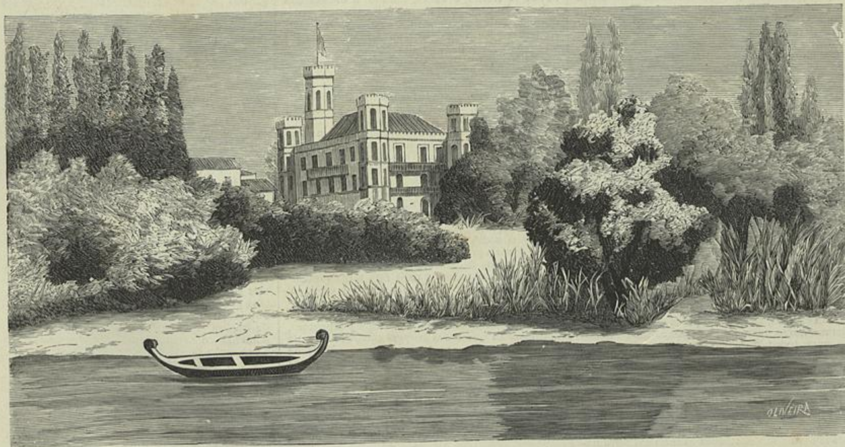
LAGO DE STARNBERG, ONDE SE SUICIDOU LUIZ II DA BAVIERA