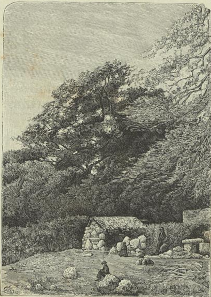
SERRA DO GEREZ — UM CURRAL DE LEONTE

AOS FUMANTES MEMORES. A União de Temperança da America do Norte apresentou, por iniciativa de miss Tobey, uma proposta á camara legis-