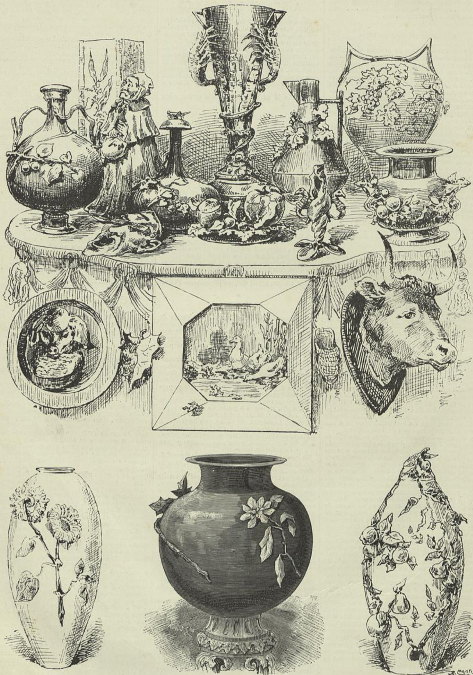
A EXPOSIÇÃO DA FABRICA DE FAIANÇAS DAS CALDAS DA RAINHA — SECÇÃO DE LOUÇA ARTISTICA, SOB A DIRECÇÃO DE RAPHAEL BORDALLO PINHEIRO (Desenhos do natural por J. Christino)