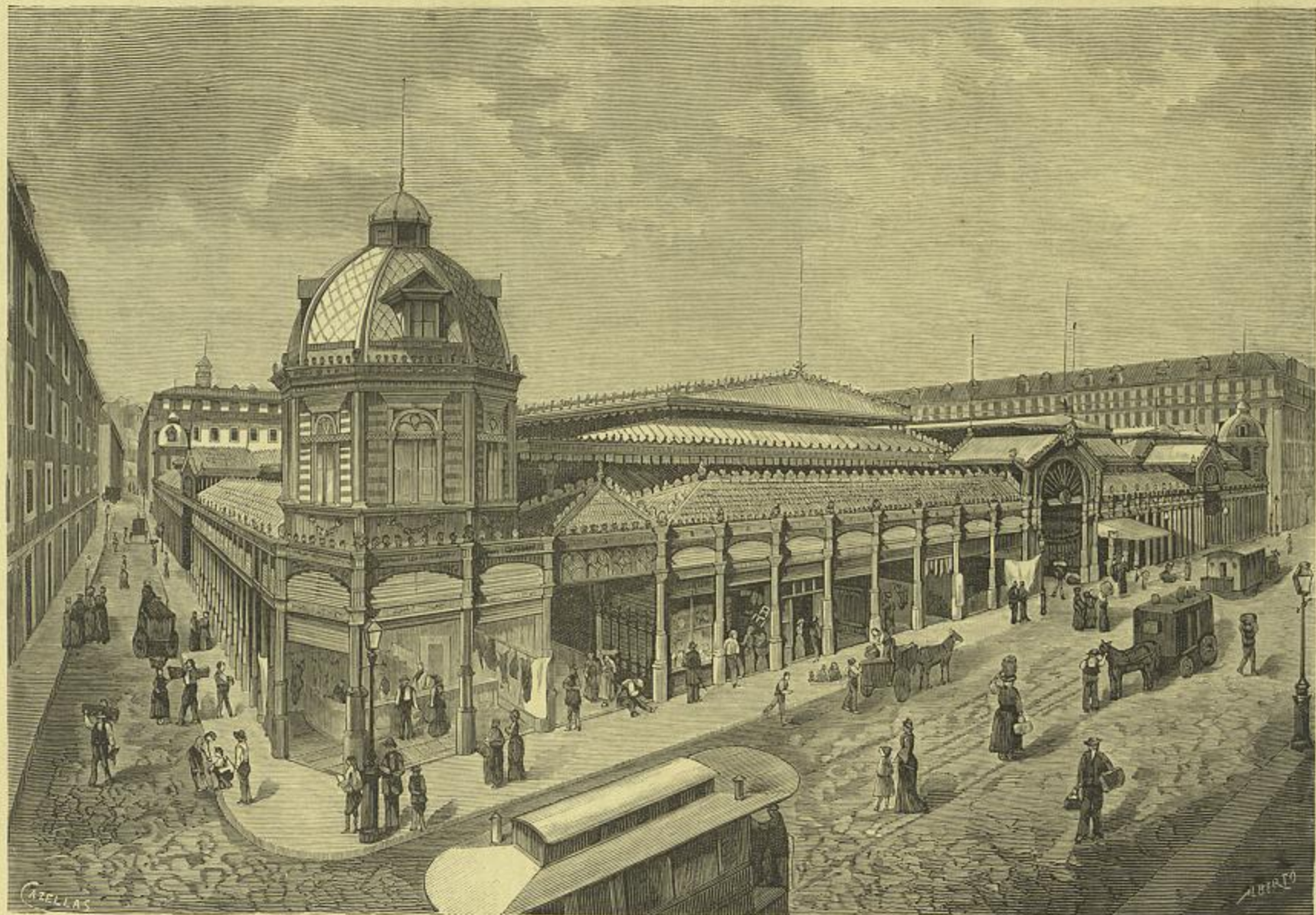
MELHORAMENTOS DE LISBOA — O NOVO MERCADO DA PRAÇA DA FIGUEIRA, VISTA EXTERIOR (Desenho do natural por Cazellias)