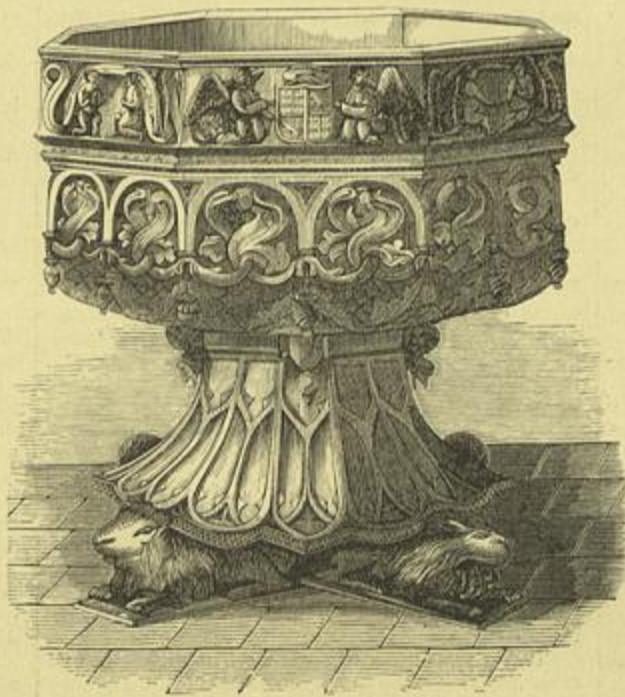
PIA BAPTISMAL DA SÉ DE COIMBRA

Antes de dormirmos uma sesta regalada até á hora de jantar, o Castro aproveitando as suas bellas qualidades de ciceroni já celebres desde o almoço no Barrocal , mostrou-me, para frisar bem o contraste, todos os utensilios da lavoira moderna.