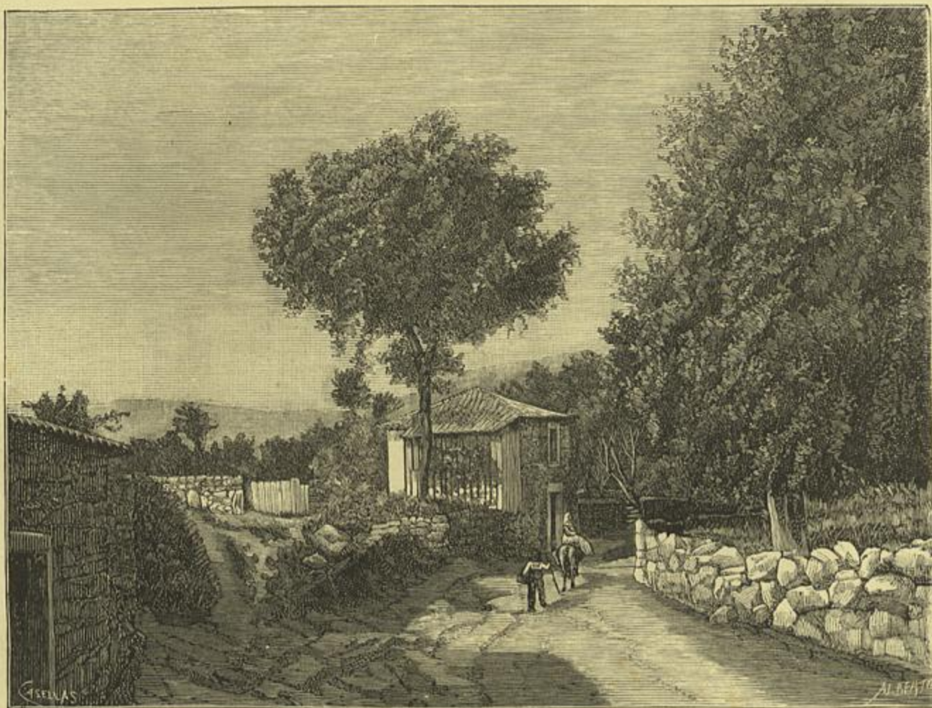
UMA PAISAGEM DE VIDAGO