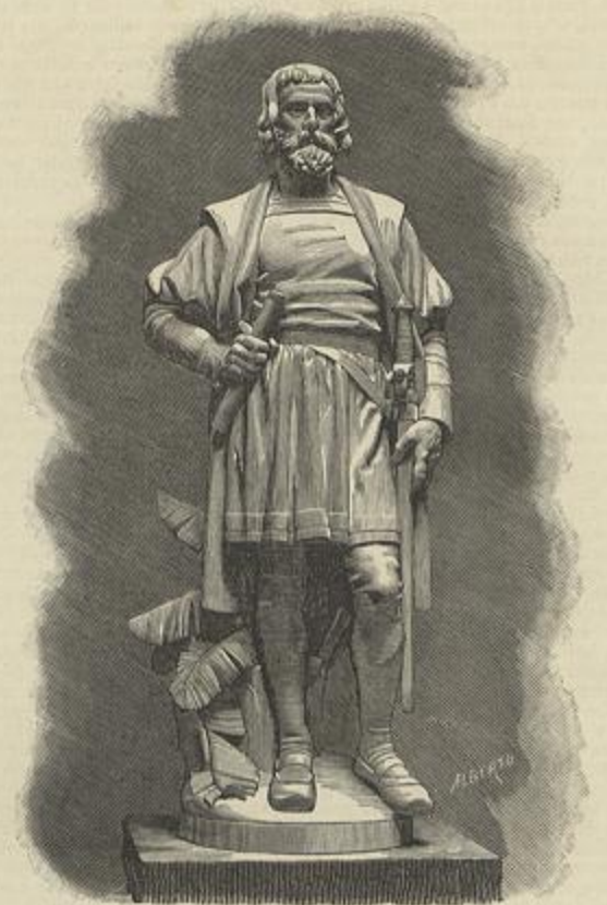
PEDRO ALVARES CABRAL

ESCUPTURAS DE SIMÕES D'ALMEIDA, DESTINADAS AO EDIFÍCIO DO GABINETE PORTUGUEZ DE LETURA, NO RIO DE JANEIRO (Segundo photographias)