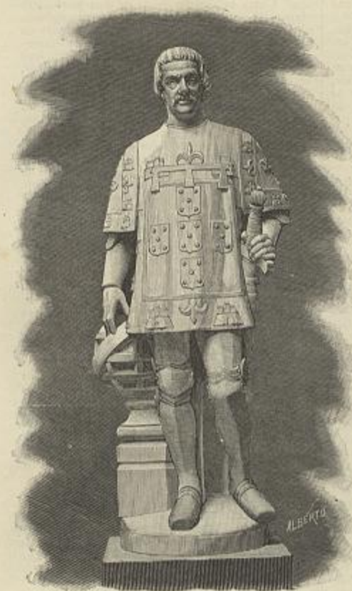
INFANTE D. HENRIQUE