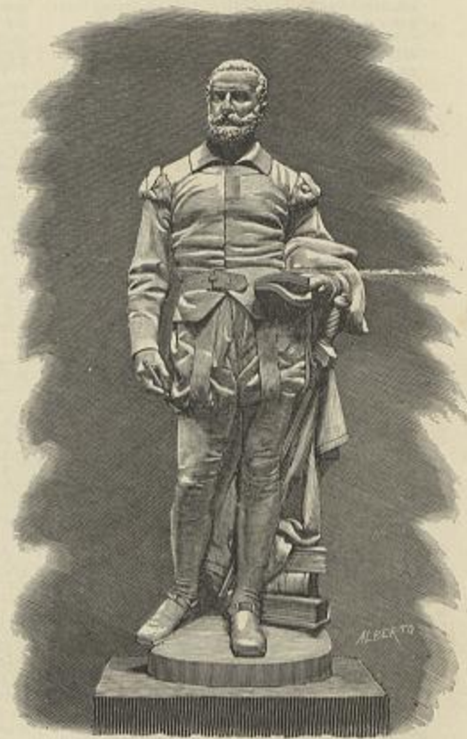
LUIZ DE CAMÕES