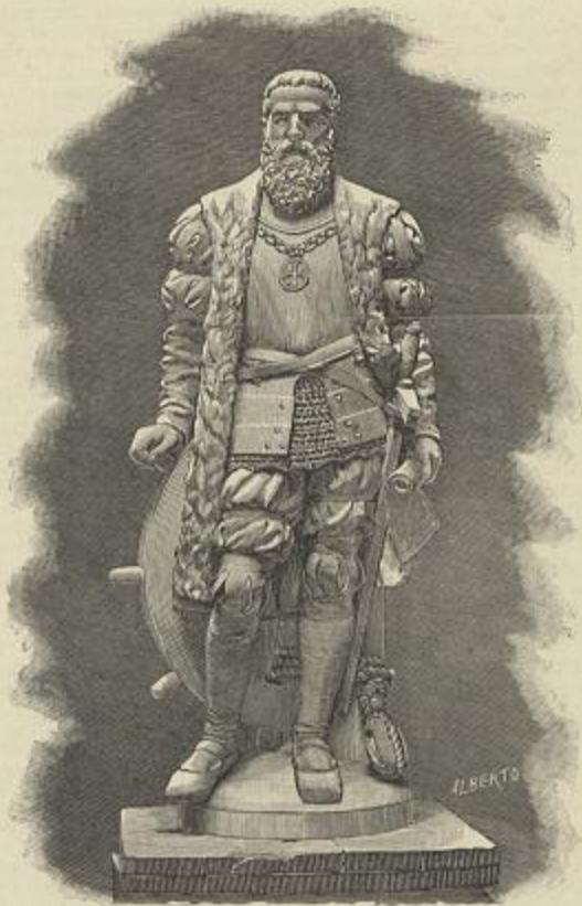
VASCO DA GAMA