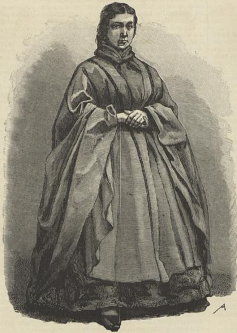
TYPO DE MULHER DAS PROVINCIAS DO NORTE DE PORTUGAL (Desenho de M. de Macedo)

REMEDIO CONTRA O CHOLERA. Não se perde por certo de mais, e por isso copiamos de um perio-