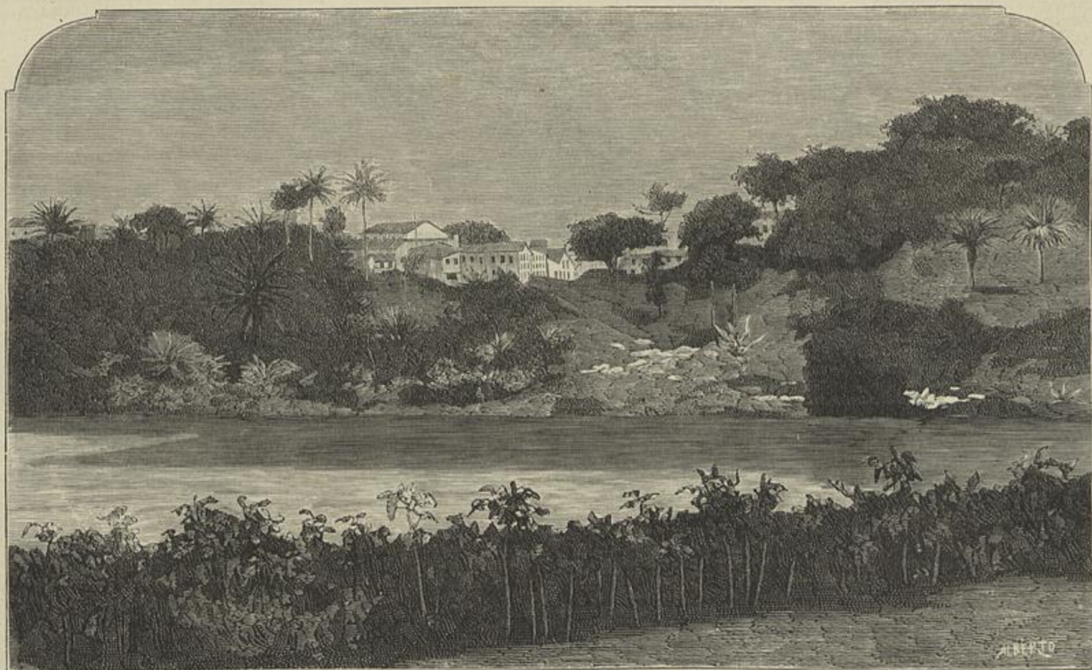
BRAZIL — O DIQUE NA BAHIA

Quem assistiu a esses trabalhos, em que até homens de 40 e 50 annos vieram buscar os primeiros rudimentos, que, ou não puderam receber em pequenos, ou haviam negligido, quem viu a alegria que animava centenaes de alumnos que jámais faziam gazetta , e se