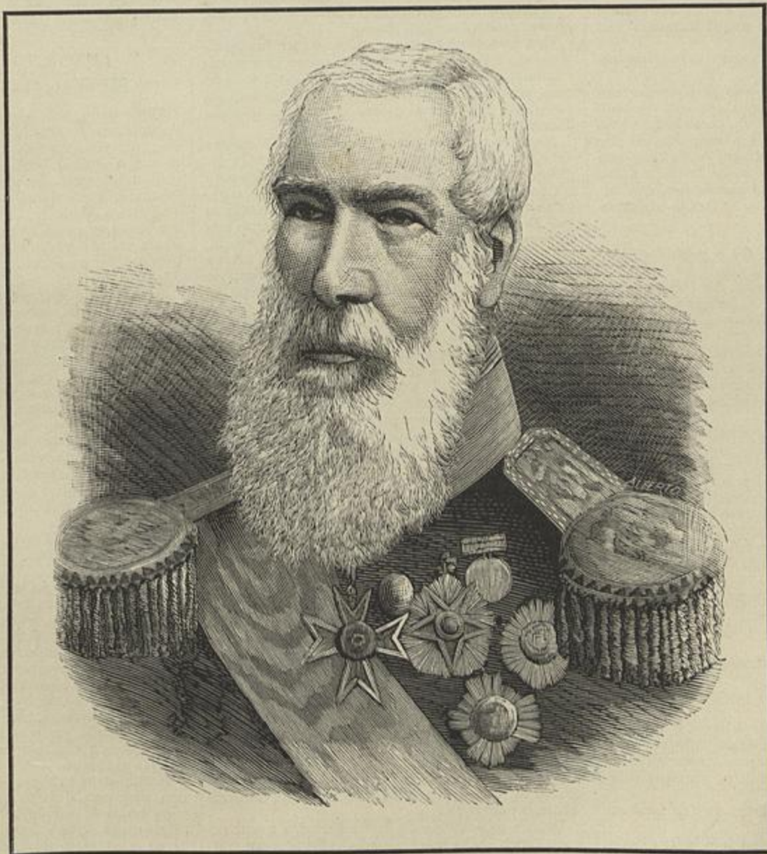
O ALMIRANTE SARTORIUS, CONDE DE PENHA FIRME — FALLECIDO EM LONDRES A 17 DE ABRIL DE 1885

O seu enterro foi enormemente concorrido, por todas as ruas do transitio a multidão apinhada olhava com tristeza para o caixão coberto de coroas saudosas, onde ia o cadaver d'aquelle sympathico homem, que a morte arrebatou em plena nomeada á gloria do seu paiz, e ao amor de sua esposa.