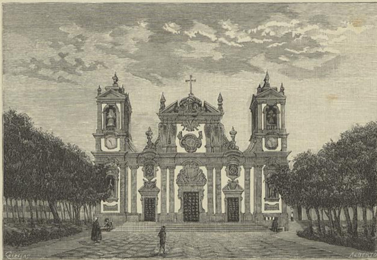
EGREJA DO SENHOR DE MATTOSINHOS (Segundo uma photographia)

EXPOSIÇÃO DE ANVERS. Foi inaugurada pelo rei Leopoldo, no dia 4 do corrente esta exposição internacional, a que concorreu a Sociedade de Geographia de Lisboa, fazendo uma importante exposição de productos das colonias portuguezas. A impressão que a secção portugueza fez n'aquelle certamen foi extraordinaria. Podéra, depois das intrigas de Stanley e quejandos, seria para surprehender que Portugal estivesse habilitado a expôr se quer um côco creado nas suas colonias. Brevemente esperamos occupar-nos d'esta exposição que honra sobre modo o nosso paiz.