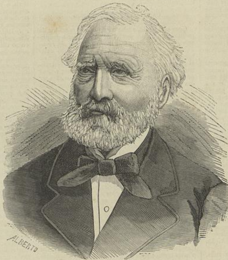
VISCONDE DE CARNIDE — FALLECIDO EM 19 DE MARÇO DE 1885 (Segundo uma photographia)

O templo apenas conserva da sua primitiva fundação a fachada principal de architectura go-