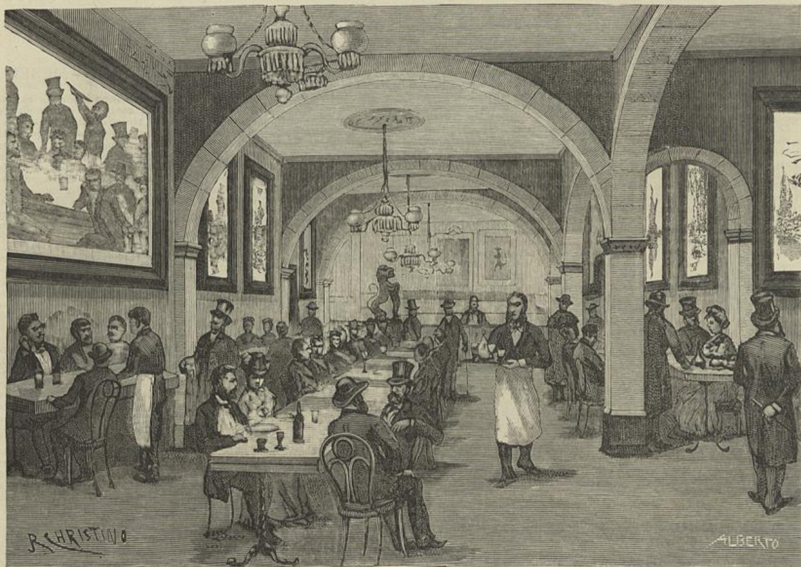
A CERVEJARIA LEÃO DE OURO, INAUGURADA EM 16 DE ABRIL DE 1885 (Desenho do natural por J. Christino)

Ora eu creio que no cartaz do Gymnasio não