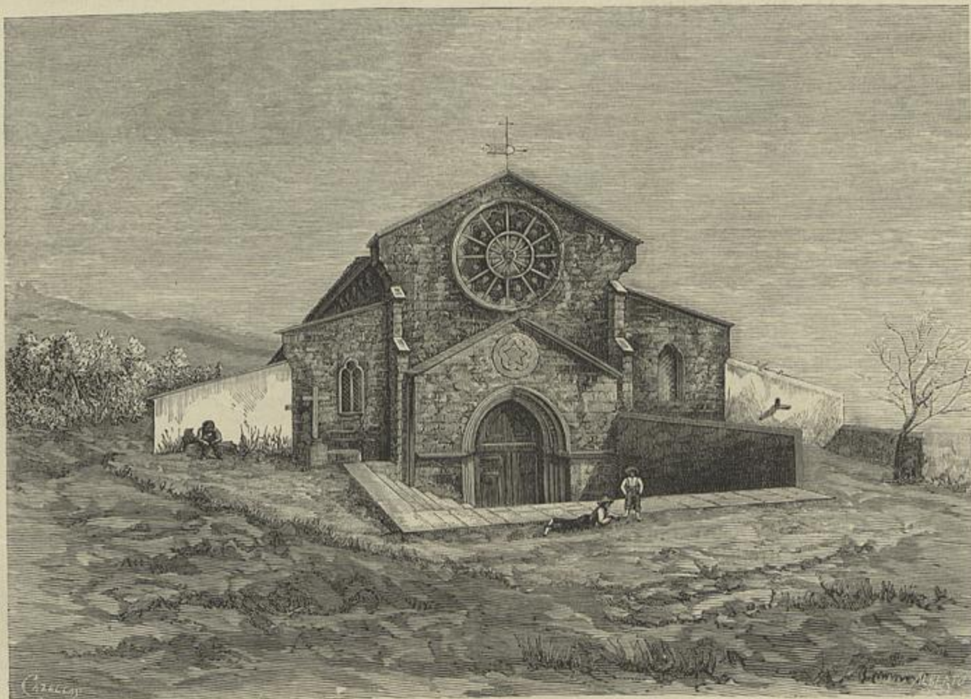
THOMAR — EGREJA MATRIZ DE SANTA MARIA DO OLIVAL (Segundo um desenho do natural de Ribeiro Arthur)

Para quem não vive em Lisboa, para quem só a conhece de visita e ignora as suas miserias intimas, avaliando-a apenas pelas exterioridades, pelo luxo que a maioria dos seus habitantes ostentam na vida exterior, em que todas as classes pretendem nivelar-se, com uma verdadeira democracia ridiculamente orgulhosa, confundindo-se o caixeiro com o capitalista, o operario com o pro-