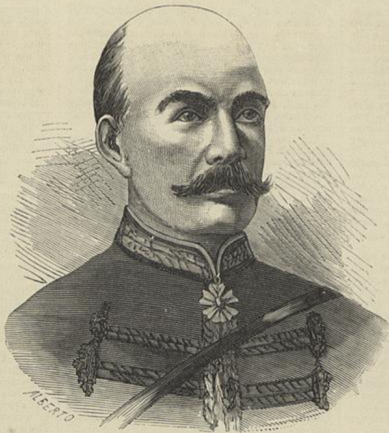
GUERRA FRANCO-CHINEZA — O GENERAL DE NÉGRIER

de juros e amortisação muito soffrivel que, fatalmente augmentará logo que se façam as obras e habilitem Lisboa a ser um dos primeiros portos do mundo. O sr. Paes conclue assim este volume: