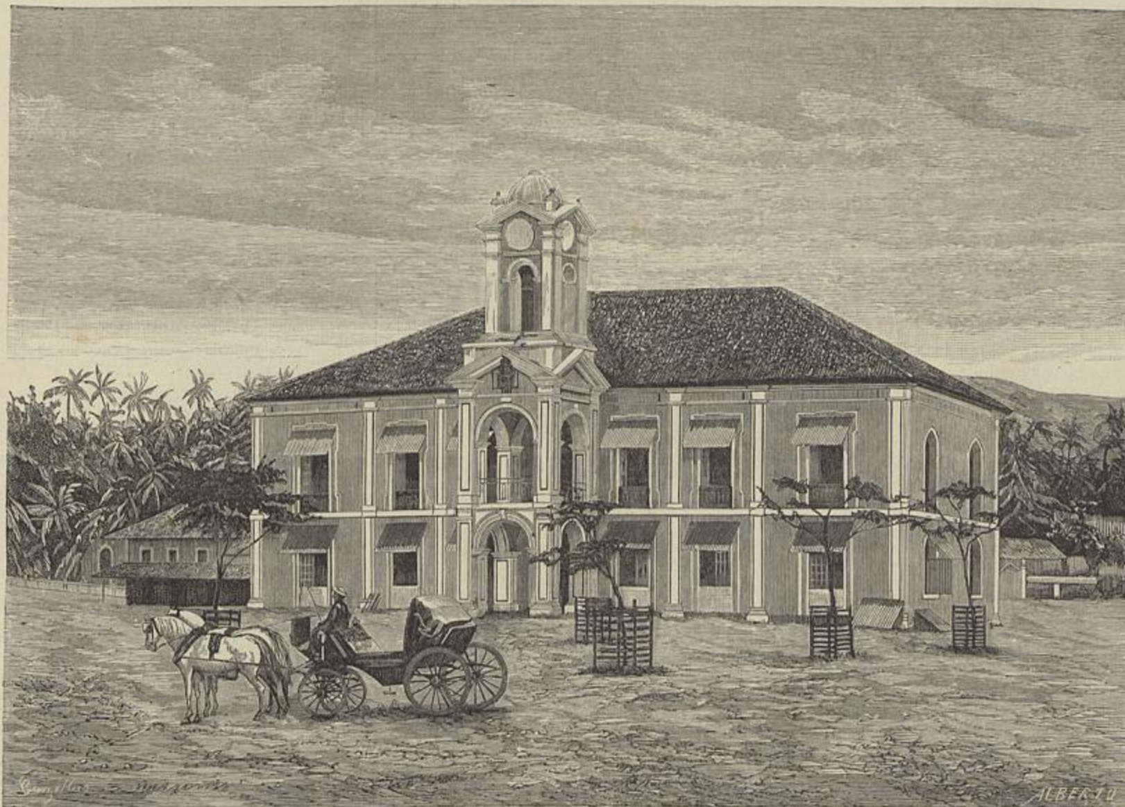
INDIA PORTUGUEZA — PAÇOS DO CONCELHO, EM PANGIM (Segundo uma photographia)

A Noute do Castello era a conversão em poema de uma das mil e uma baladas e historias da epoca das cruzadas, como tantas ouvimos contar em pequenos; e com quanto se lhe quizesse logo dar parentesco com esta ou com aquella, é certo que o facto é commum a varias, com maior ou menor differença nas peripecias. Nem valia a pena perder tempo a discutir esse ponto. O as-