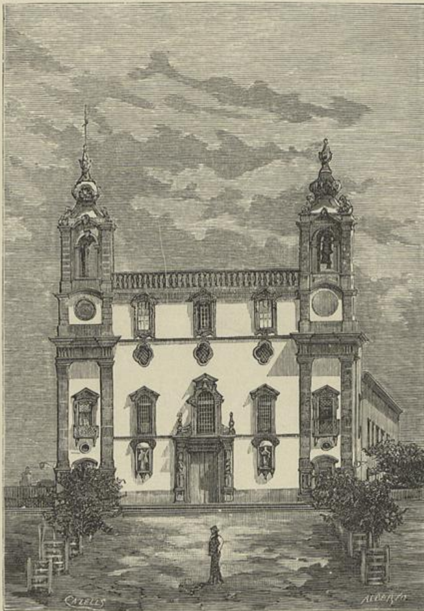
EGREJA DE NOSSA SENHORA DO CARMO, EM FARO (Segundo uma photographia)

Typ. ELZEVIRIANA — Praça dos Restauradores, 50 a 56 — Lisboa.