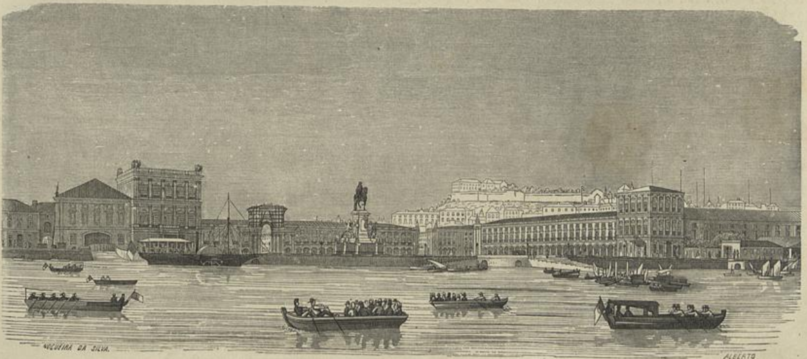
UM DESENHO INEDITO DE NOGUEIRA DA SILVA — A PRAÇA DO COMMÉRCIO, EM LISBOA, VISTA DO TEJO

Esperamos fazer uma digressão artistica por aquella provincia, e alli fazemos boa colheita de desenhos e noticias, que publicaremos.