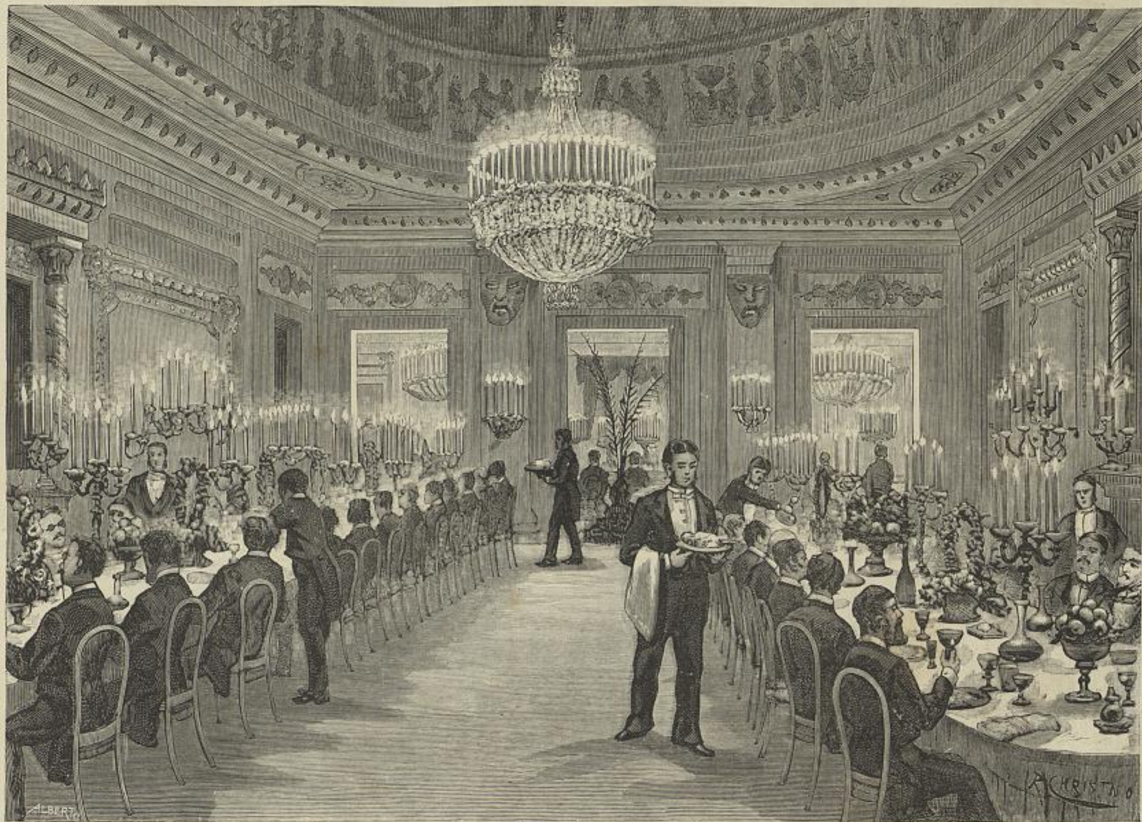
JANTAR OFFERECIDO AOS MENEROS DO CONGRESSO POSTAL, NAS SALAS DO MINISTERIO DOS NEGOCIOS EXTRANGEIROS (Desenho do natural por Christino)