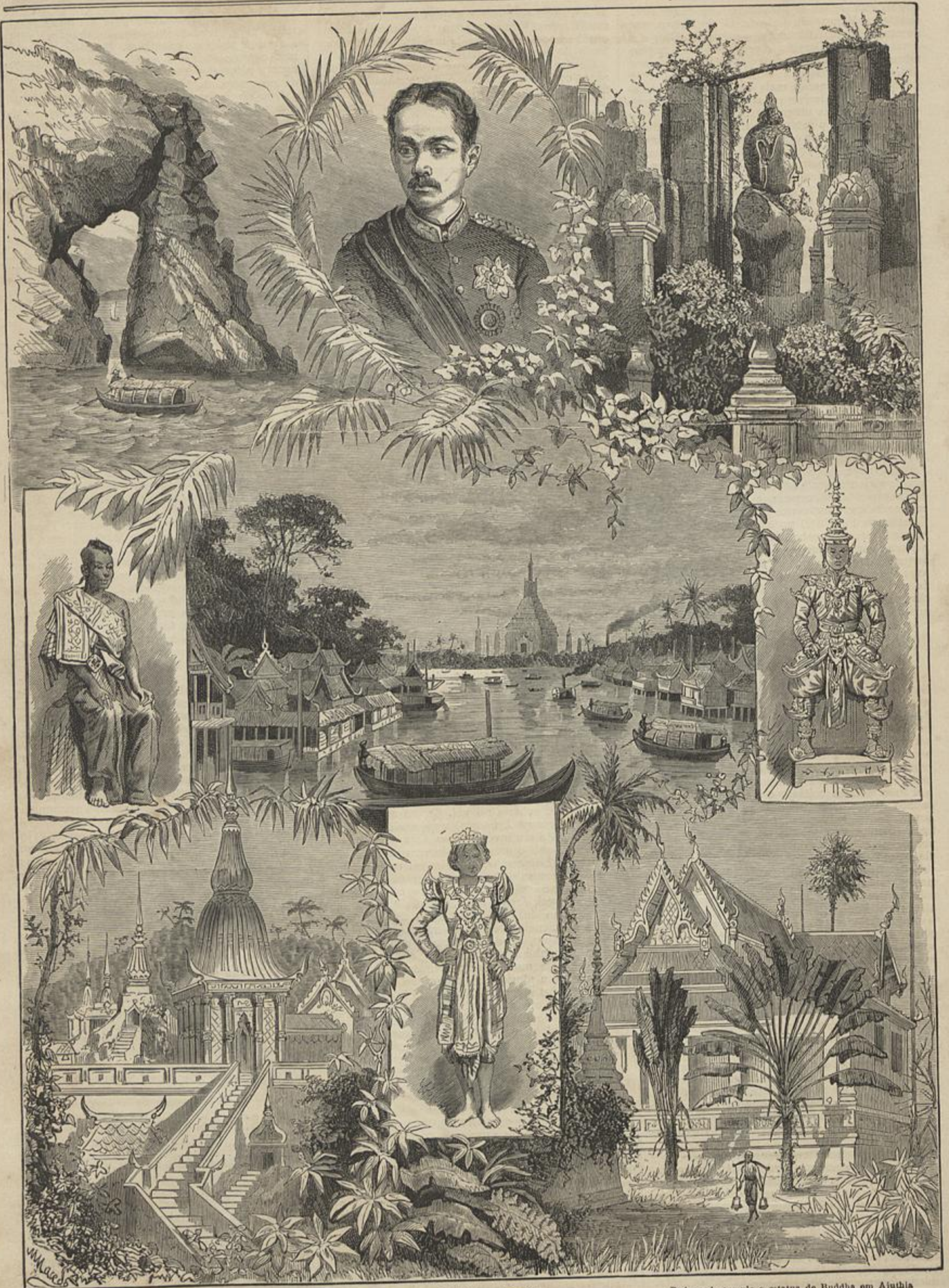
Fortico de rochas no golfo de Sião Dama de gerarchia Mosteiro Buddhista em Pharabat