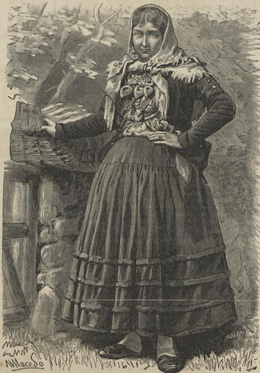
COSTUMES PORTUGUEZES — MULHER DOS ARREDORES DO PORTO

Oxalá que um dia breve tudo isso desapareça dos jornaes, e que essas tagarelles de senhoras visinhas desapareçam e cedam o campo ás noticias serias e uteis das investigações scientificas, dos progressos materiaes e intellectuaes da sociedade, do an-