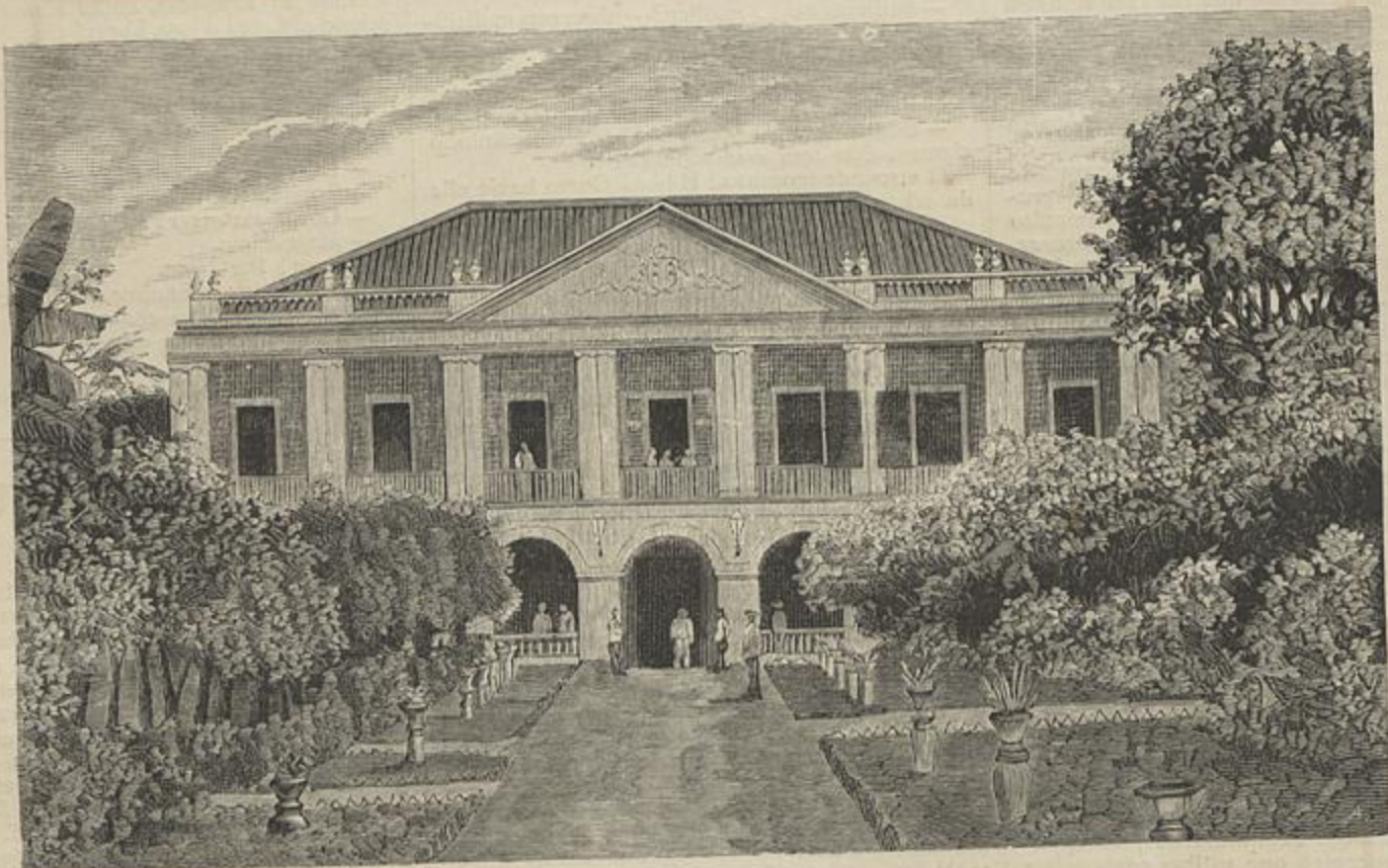
SIAM — PALACIO CONSULAR DE PORTUGAL, EM BANGKOK Segundo uma photographia)