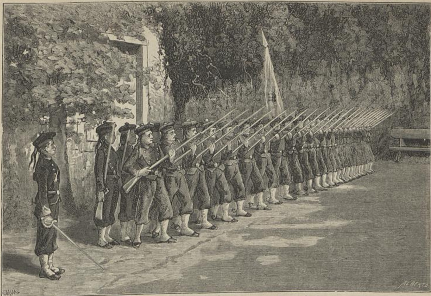
BATALHÃO ESCOLAR DAS ESCOLAS MUNICIPAES DE LISBOA (Desenho do natural por Macedo e Christino)

em volta do cymbalo amarelento um delicioso barulho de corpitos gordanchudos em desencontradas posições, e dá umas bellas manchas de carnes rosadas e tenras d'um magnifico tom, e d'um toque ligeiro e fresco.