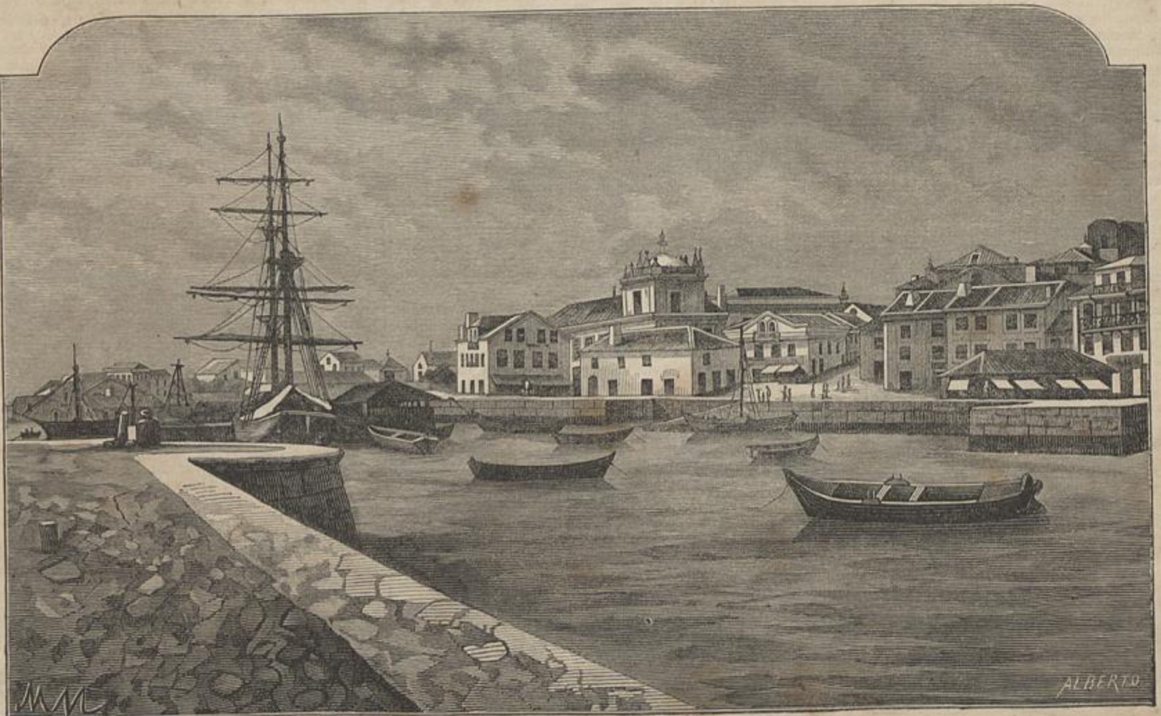
FIGUEIRA DA FOZ

Escusado é dizer que depois dos primeiros successos dos inglezes no Egypto, o Sultão da