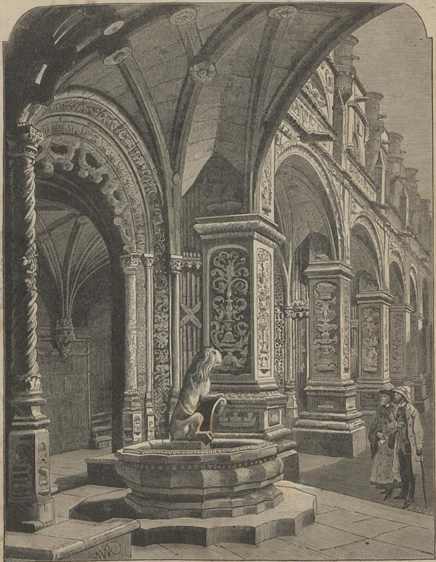
CONVENTO DOS JERONYMOS, EM BELEM — CLAUSTRO (Segundo uma photographia)