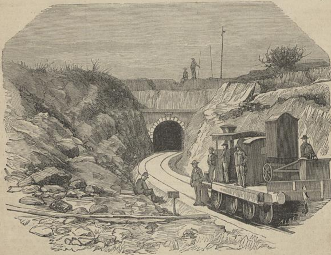
CAMINHOS DE FERRO PORTUGUEZES — TUNNEL DE ALHANDAR, NO CAMINHO DE FERRO DA BEIRA ALTA

Lallemant Frères, Typ. 6, Rue du Theatru Velho, 6