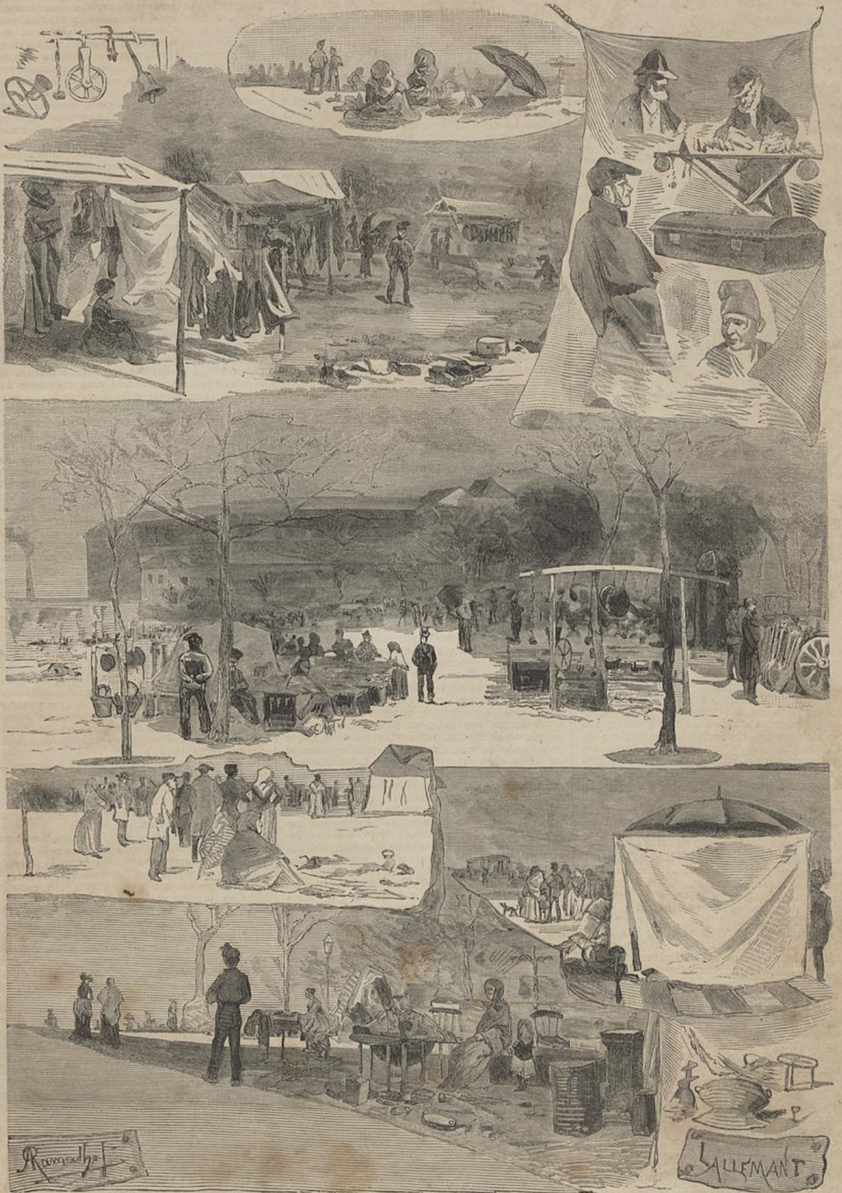
LISBOA — A FEIRA DA LADRA NO CAMPO DE SANT'ANNA (Apontamentos do natural por Antonio Ramalho)