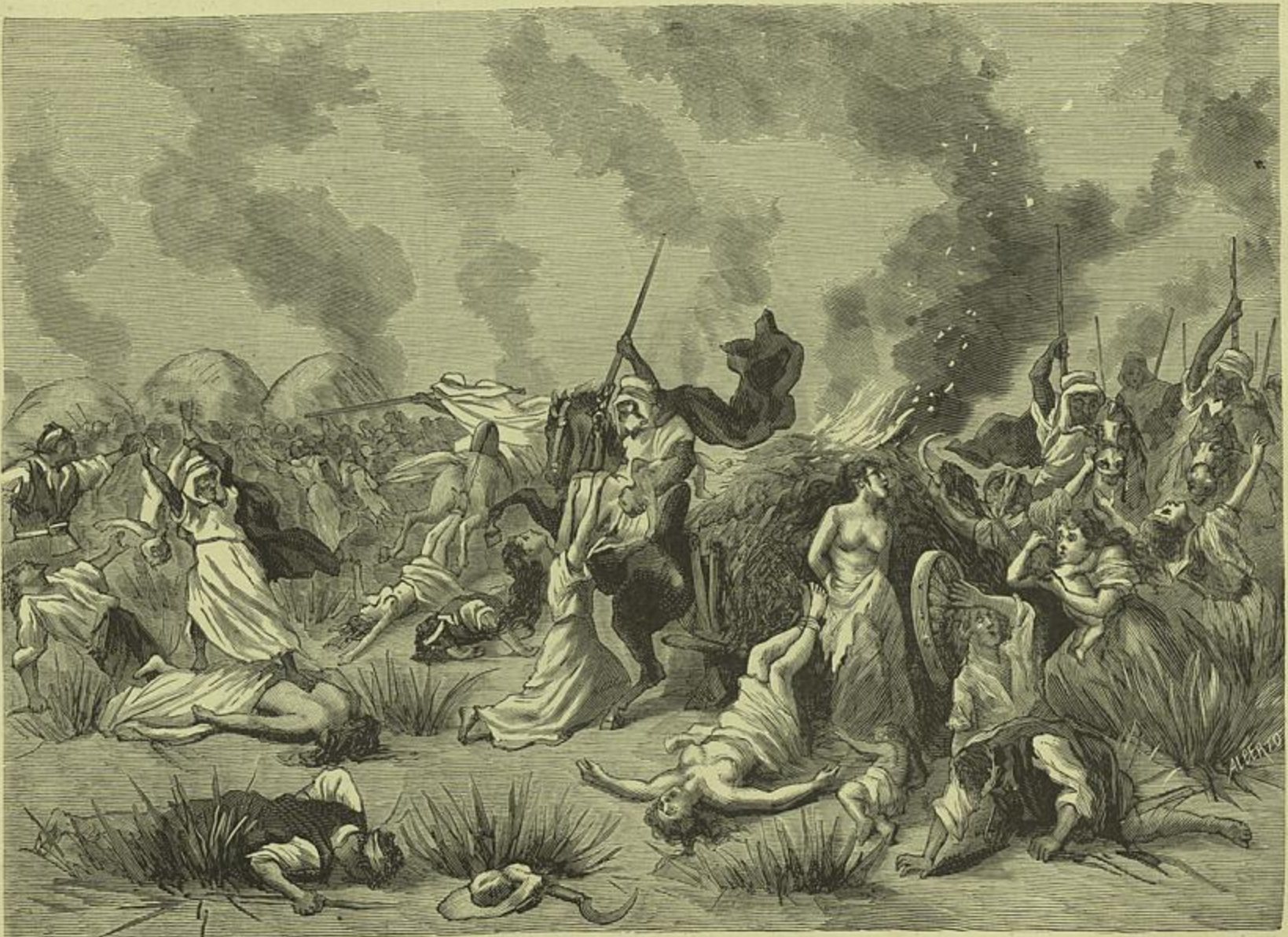
INSURREIÇÃO NA ALGERIA — MATANÇA DOS ESPARTEIROS HESPAHOES EM ORAN

Os recentes acontecimentos da provincia d'Oran tem chamado para a Algeria as attenções da Europa. Aquella guerra terrivel, chamada guerra santa, contra os europeus, derigida por Bou-Amena, um personagem perfeitamente phantas-