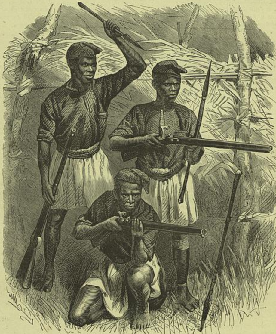
CAÇADORES DE INHAMBANE — (Segundo uma photographia)

tribuna, na parte superior, dentro em um nicho, uma custodia sustentando o coração de Christo com uma reliquia do santo lenho; em veneração a ella via-se um seraphim com seis azas que occultava ou manifestava graciosamente nas funcções da confraria. Esta capella encerrava muitas outras curiosidades.