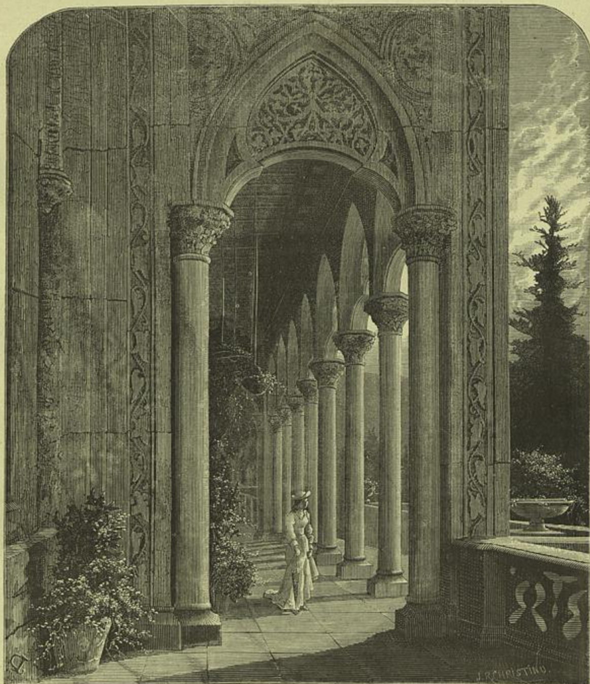
CINTRA — GALERIA EXTERIOR DO PALACIO DE MONSERRATE

Desde o dia 24 de julho, um dia escolhido para a prisão, parece que como ponto para thema de exame de terceiro anno de portuguez: «exercício de estylo violento de artigo de fundo, com antitheses vigorosas e contrastes frisantes» até ao dia 27 do mesmo mez, isto é, em tres dias, o editor do Seculo passou pela sensação, pouco conhecida dos editores dos jornaes portuguezes, de ser preso por três vezes, e de por tres vezes ter depositado nas