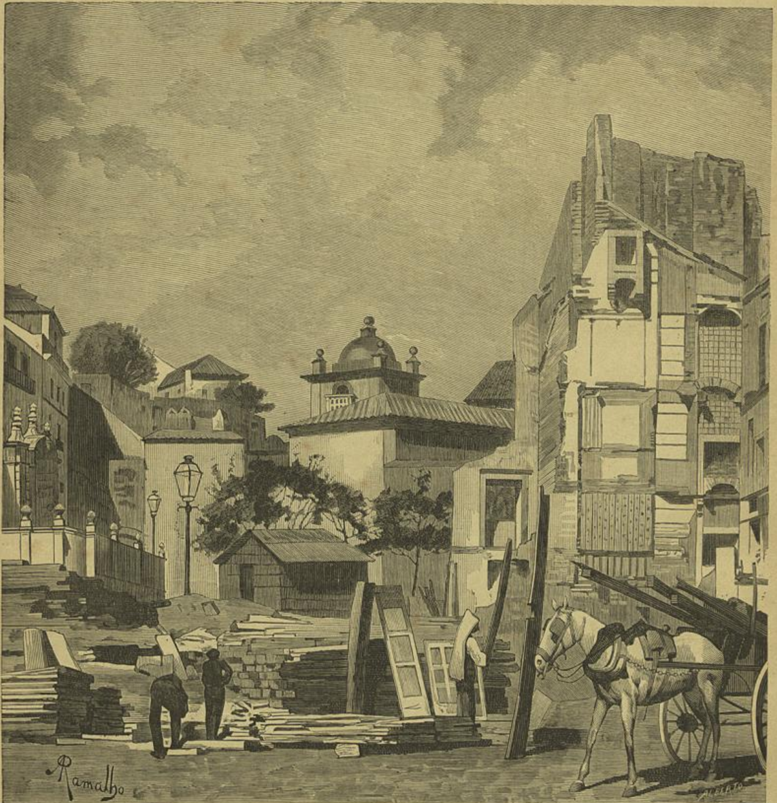
MELHORAMENTOS DE LISBOA — RUA DO DUQUE DA TERCEIRA — DEMOLIÇÕES NO LARGO DA ESPERANÇA