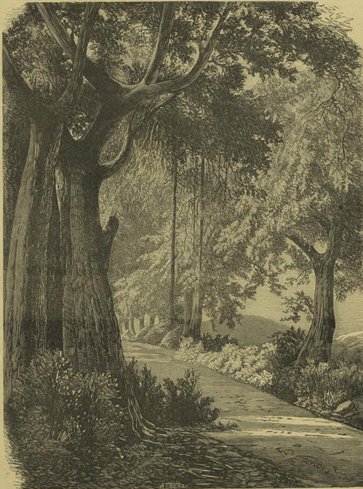
MOÇAMBIQUE — NA PONTA DA ILHA, 2.ª VISTA (Vidè artigo a pag. 235 do presente vol.)