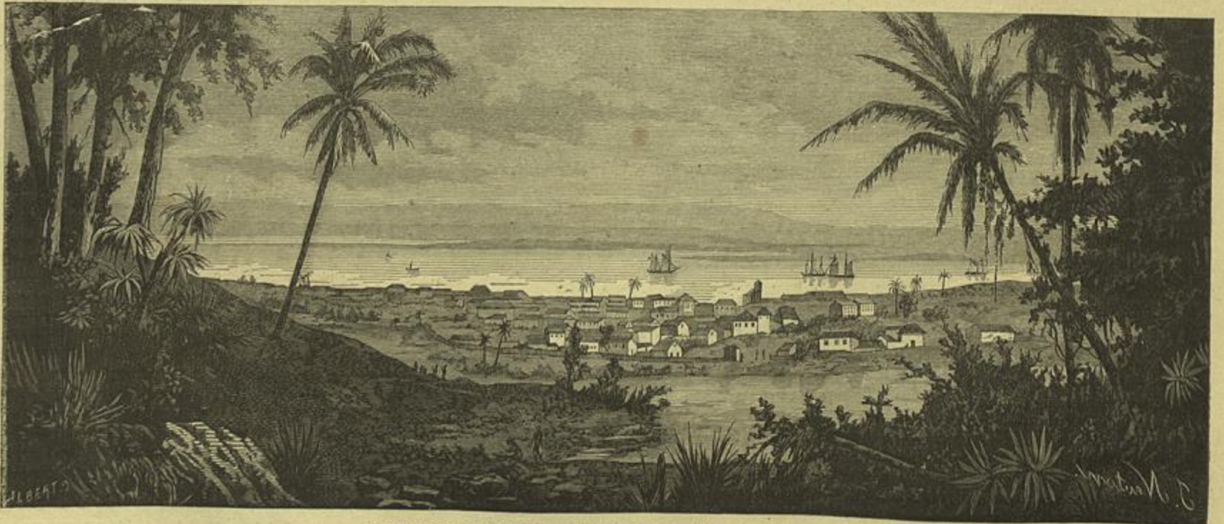
LOURENÇO MARQUES — (Desenho do natural por Isaias' Newton)