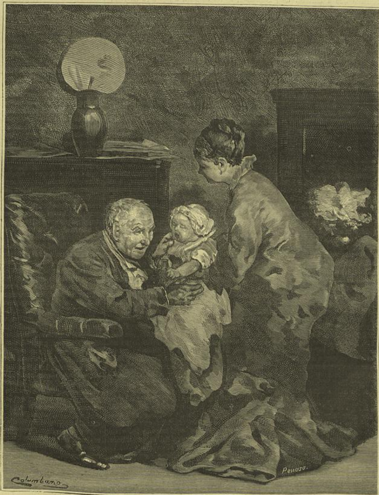
O AVÓ — Quadro de Colombano Bordallo Pinheiro (Desenho do mesmo auctor)

EXPOSIÇÃO DA SOCIEDADE PROMOTORA DE BELLAS ARTES EM PORTUGAL, EM 1880