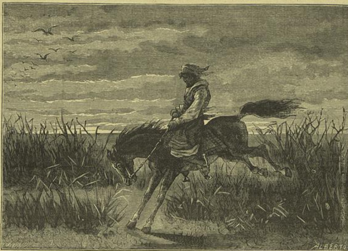
UM GAUCHO NA PAMPA (Vide artigo Buenos Aires á Pampa)

As artes e as letras pois, em competencia, correspondendo aos desejos e intenção d'aquella illustre sociedade, deram-se as mãos para que ella podesse levantar um pequeno monumento á gloria do grande poeta, á qual já agora ficará eternamente ligado o nome d'aquella benemerita associação.