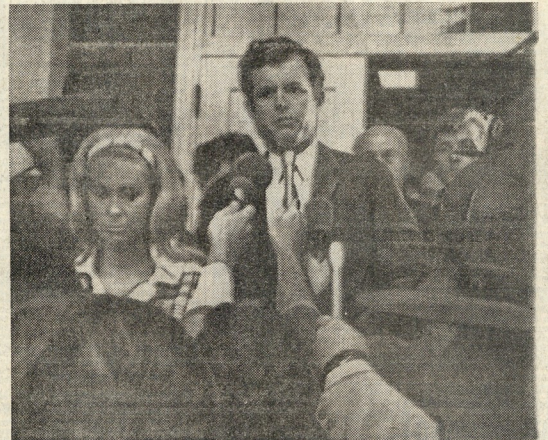
O senador Edward Kennedy (ao centro), acompanhado pela sua mulher, Joan (à esquerda), responde a perguntas de jornalistas à saída do Tribunal de Duques County, após ter sido condenado a dois meses de prisão, com pena suspensa