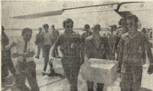
Um agente dos serviços de segurança da N.A.S.A. a fazer um fotógrafo, no momento em que uma das preciosas caixas, com amostras do solo lunar, é transportada para um carro, que a levará para o Centro de Voos Espaciais Tripulados, em Houston

A Corrida da Imprensa, que se realizará na praça de toiros do Campo Pequeno, na noite do próximo dia 31, será uma vez mais grande acontecimento para os afluídos à festa de toiros. Numa conferência de imprensa que esta manhã decorrerá na Casa da Imprensa será comunicado o programa da maior corrida do ano.