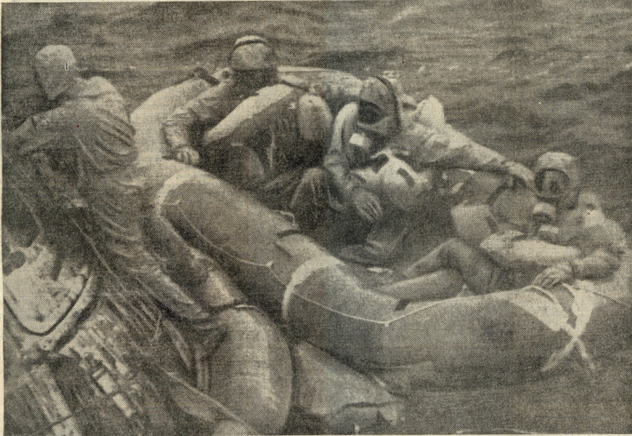
Pouco depois da amarração, os três astronautas (um deles já de perna traçada) sentados no bote de borracha, esperam que o tenente Clancy Hatleberger, do corpo de homens-rãs da Marinha, acabe o seu trabalho no módulo de comando