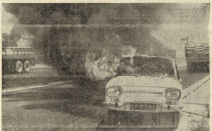
Foi ontem, na auto-estrada do Norte, próximo de Vila Franca. O automóvel ultrapassou uma camioneta e parou. Houve colisão e a gasolina, derramada, incendiou-se. O veículo foi pasto das chamas. Lá dentro, inanimada, a mulher do condutor morreu carbonizada (NA 4.ª PAGINA)