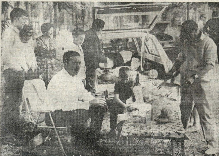
Junto do Estádio Nacional, adeptos do Benfica almoçam tranquilamente

...E muitos comeram-no acampados no Vale do Jamor. Nas matas próximas do estádio desde muito cedo que começaram as pessoas a arranjar piqueniques. E cerca do meio-dia já ali se encontravam milhares de adeptos, quase todos do Benfica. Famílias inteiras em pátio, em festa, em ansiedade. A hora do jogo demorava a chegar. Mas, entretanto, a festa já começara.