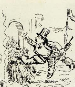
Eu ia no concors