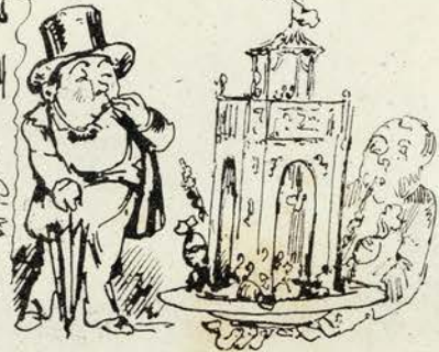
Isso estava bello. Então caracos?! Isso obra minha.