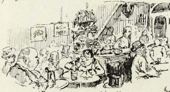
Com a paola e lo concors fui chupar um sherry-cobber no Café Americano

Por causa deis ingratissimos finto aqui, ficando assim como o mes illustre ante passado o celebre Sr. Fongo, o gozilha se Loureos. E o Sr. Dr. Miranda Azeredo que me não vio. Que bello exemplar!