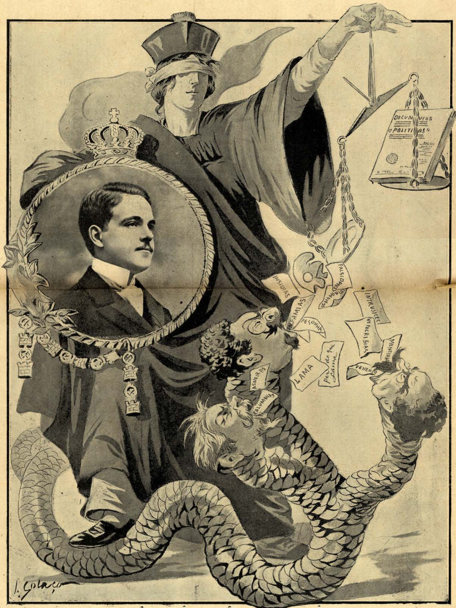
Um triumpho para El-Rei