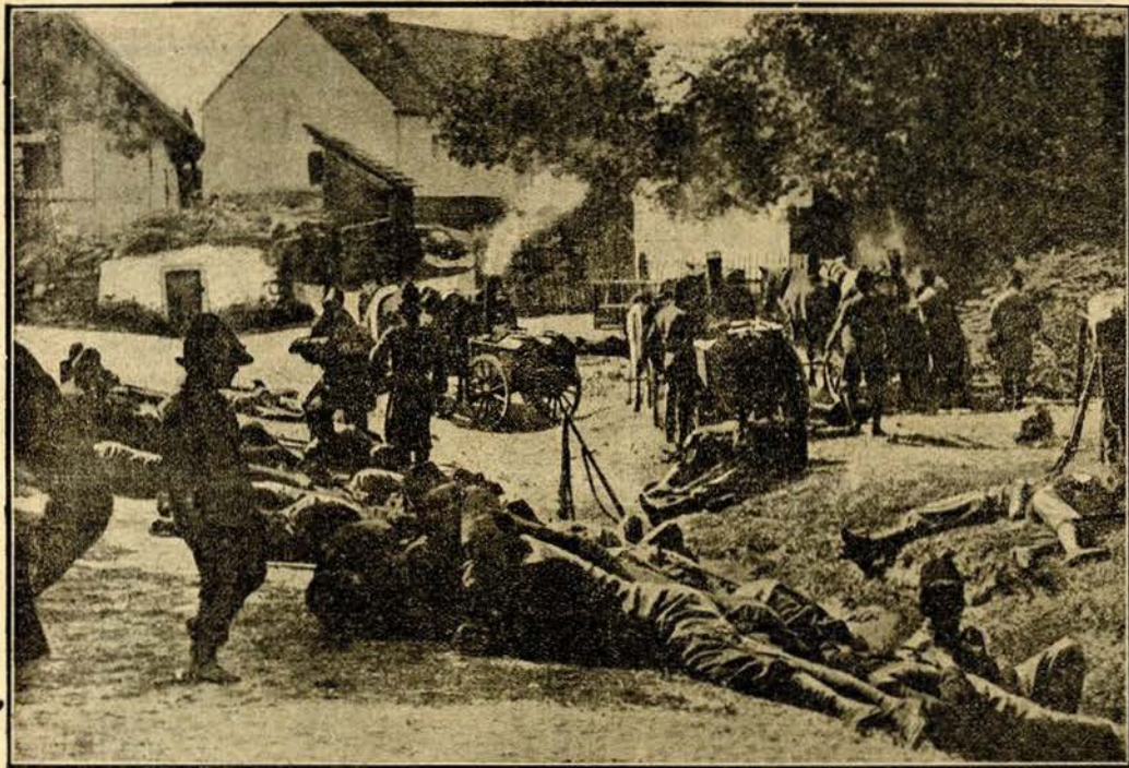
Soldados austriacos bivacando nas margens do Danubio