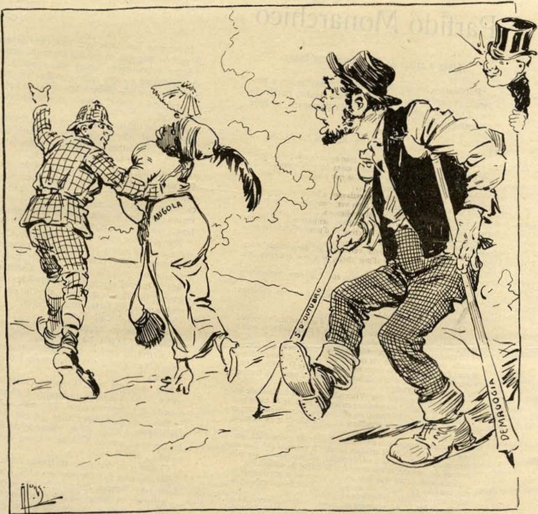
Assobia-lhe ás botas...