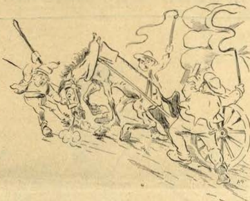
Todos os dias do anno (ambos puxam)