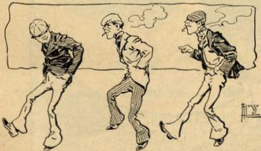
A privativa de Sua Excellencia