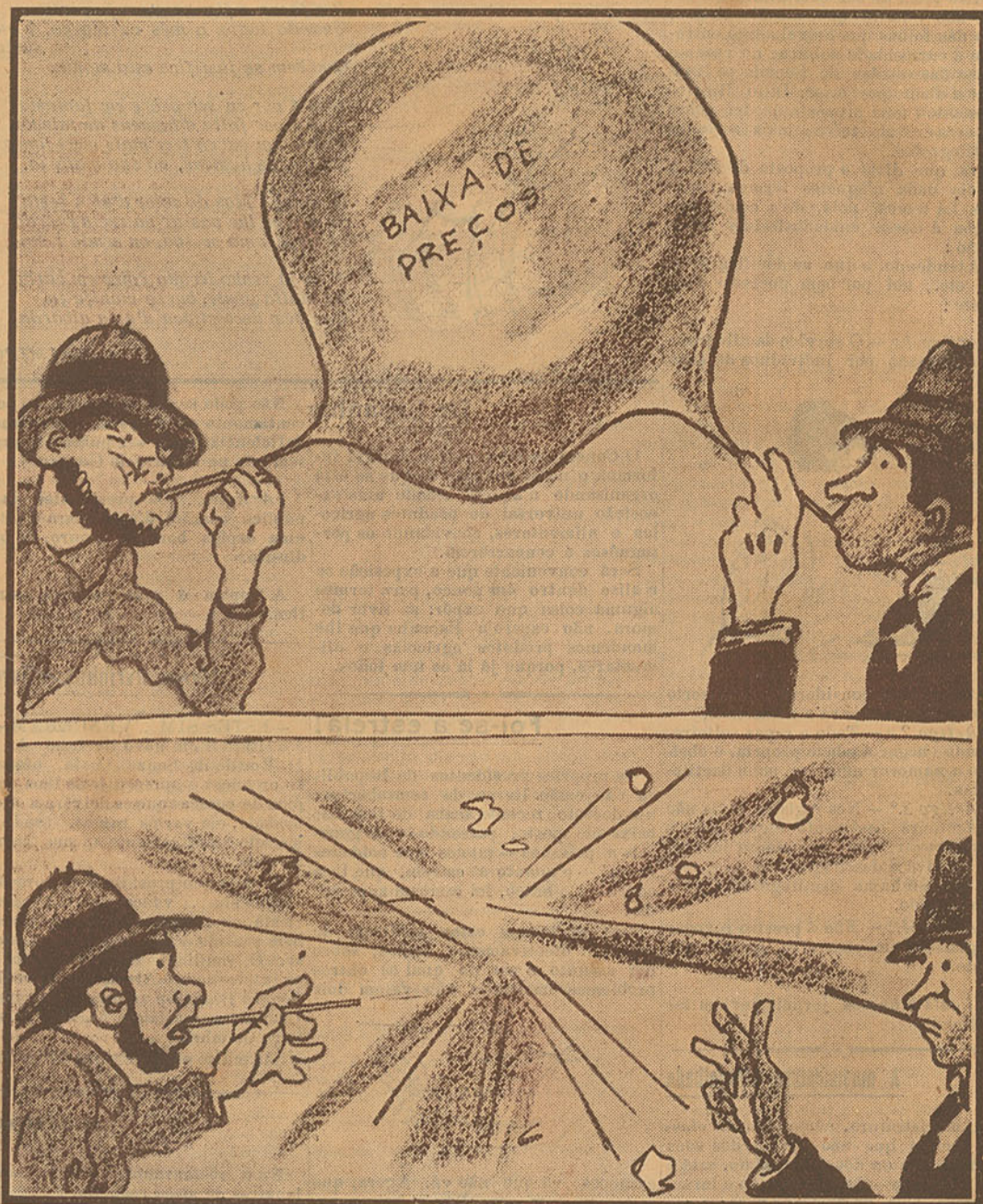
A eterna bola de sabão.