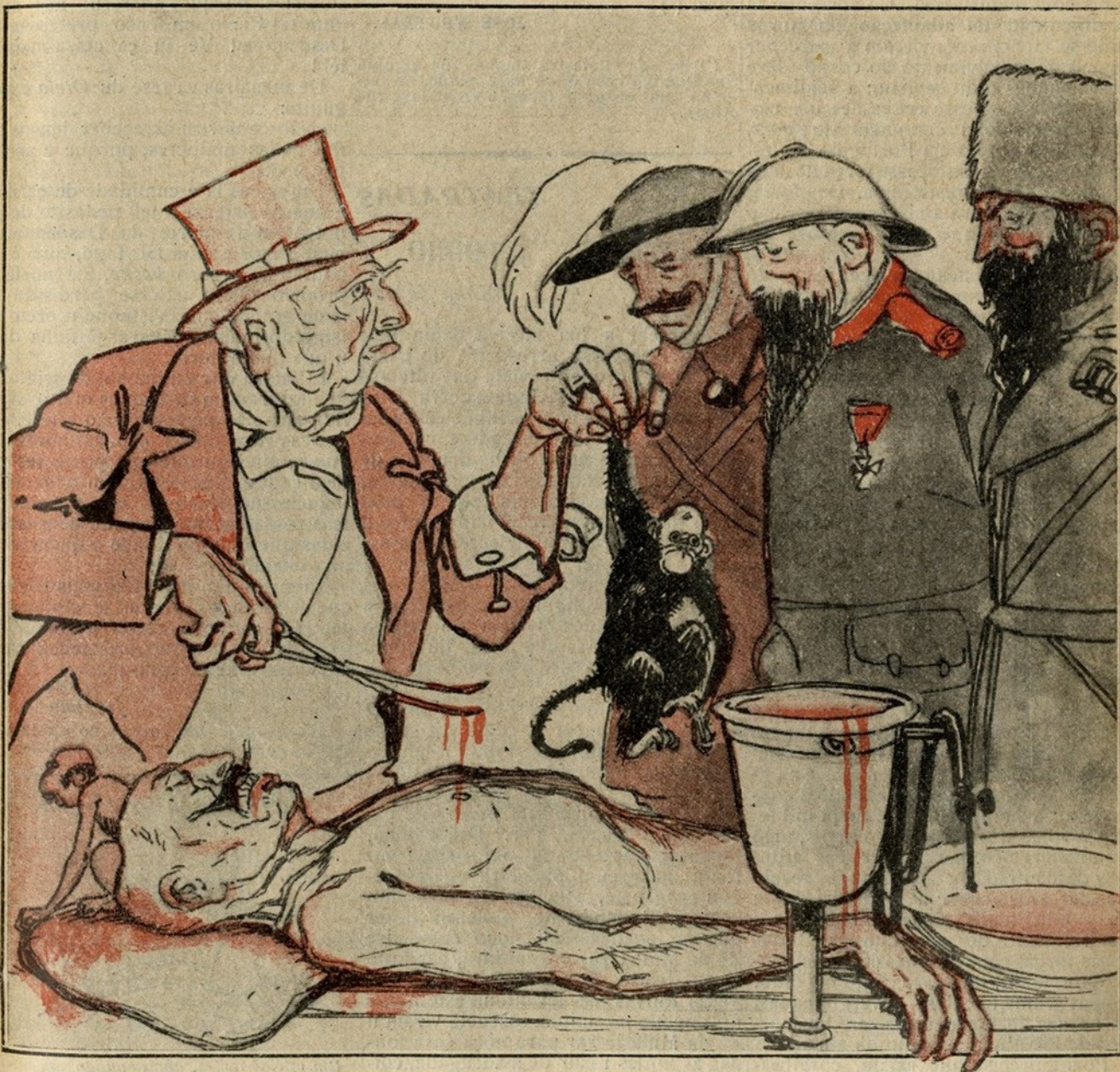
Depois da guerra. — Efectivamente o responsavel não foi ele, mas os macaquinhos que tinha no sofá...