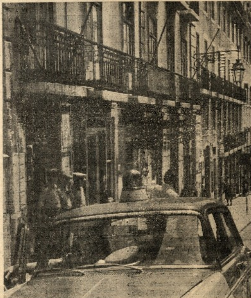
Casa fechada, polícia à porta — eis a situação que estamos firmemente empenhados em modificar, na aplicação revolucionária das leis revolucionárias.

A terminar, o comunicado do núcleo do P. S. da Emissora Nacional afirma a sua solidariedade à direcção e redacção do «República» e os mesmos ideais de luta por uma Informação livre, pluralista, independente, crítica e vincadamente progressista, luta que «não é só nossa, mas de todos os trabalhadores da E. N. e do povo português.»