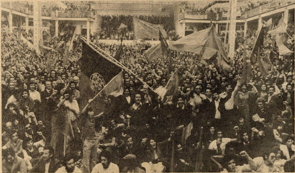
Liberdade de expressão: tema para um Pavilhão dos Desportos a abarrotar

«E o povo já disse claramente que quer o socialismo e quer a liberdade!