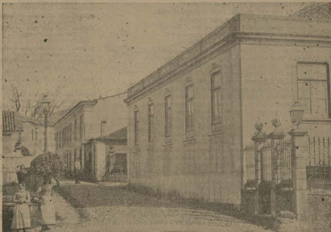
SERNACHE DO BOMJARDIM — Uma rua

Vida socegada, tranquila e feliz, tanto na constancia do matrimonio como depois da morte do marido.